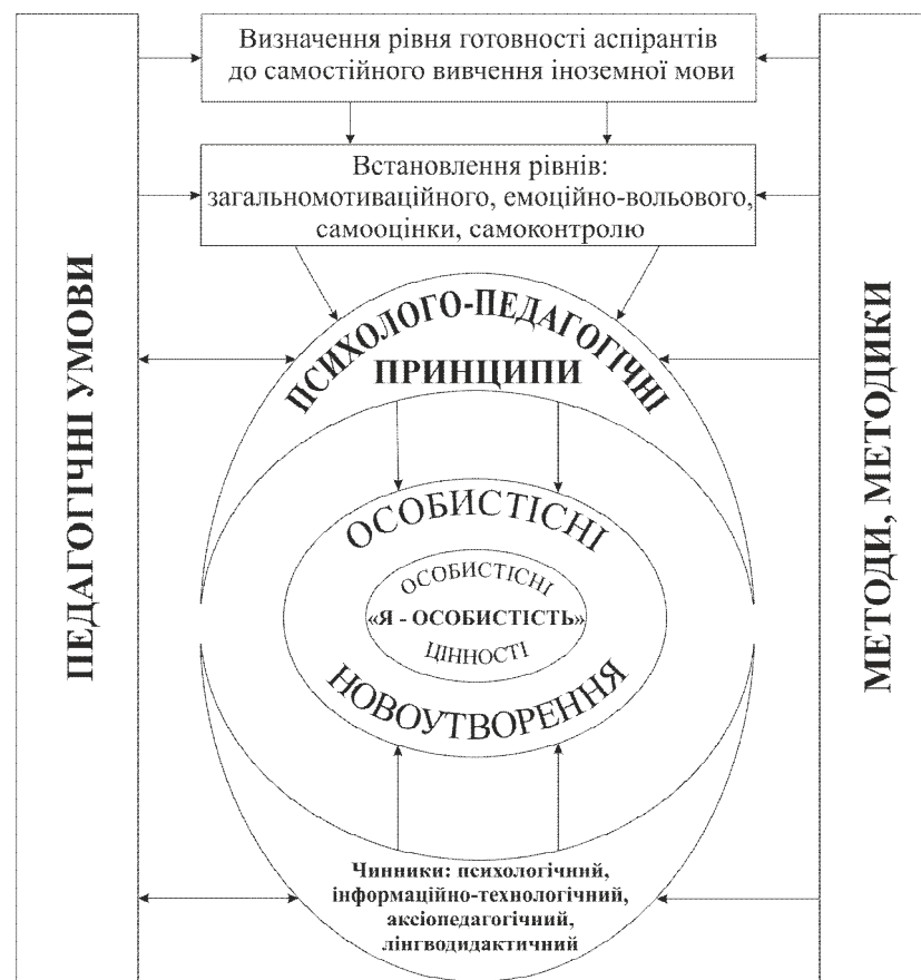
Рис. 1. Модель самостійної роботи аспіранта з вивчення іноземної мови.

Проектування структури самостійної роботи аспірантів з вивчення іноземної мови передбачало виокремлення кількох взаємозалежних складових: загальномотиваційного рівня; чотирьох вищеписаних компонентів; психолого-педагогічних методів та принципів; кінцевих цілей комплексного (аудиторного та самостійного) навчання. Відтак, модель самостійної роботи аспірантів із вивчення іноземної мови виглядатиме, як зображено на Рис. 1.