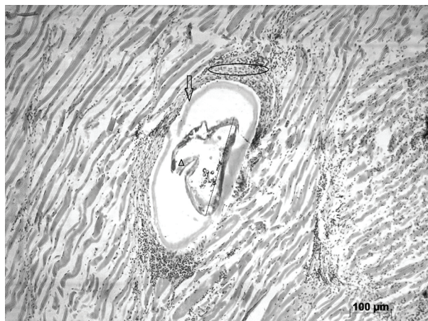
Figura 3. Pared muscular estriada con la presencia de Lernaesa cyprinacea en el centro de la imagen, rodeada por una cutícula homogénea eosinófila (flecha), por fuera de la cual hay infiltrado inflamatorio (círculo). La cabeza de flecha muestra las “anclas” del parásito. HE 40 X. Escala de la barra 100 μm.

Luego de la confirmación de la infestación por Lerneosis se procedió a realizar un tratamiento con baños de sal (proporción al 5 % durante dos minutos) (Tonguthai, 1997), los cuales no surtieron efecto. Dos días después del tratamiento, toda la población murió.