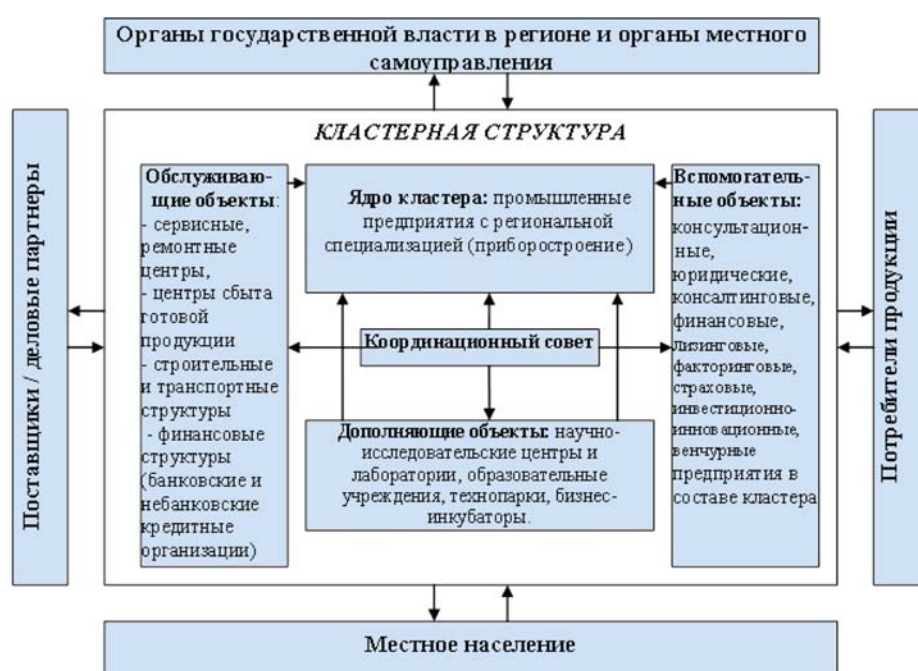
Рис. 3. Модель инновационного кластера в старом промышленном районе 3

С учетом всего вышесказанного можно сформулировать общую модель инновационного кластера в старом промышленном регионе (рис. 3).