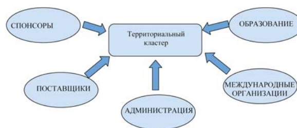
Рис. 1. Внешний мир территориального кластера 2

Кластер представляет собой, прежде всего, сетевую форму, так как близкое расположение предприятий обуславливает определенную общность и увеличивает частоту и силу их взаимодействия 1 . Говоря о кластере, следует рассматривать его структуру как добровольное партнерское объединение по территориальному признаку производственных и других предприятий, расположенных на данной территории или тяготеющих к ней. Цель – получение индивидуальной и совместной экономической и/или другой выгоды на основе комплексного удовлетворения своих производственных нужд и запросов потребителей (рис. 1).