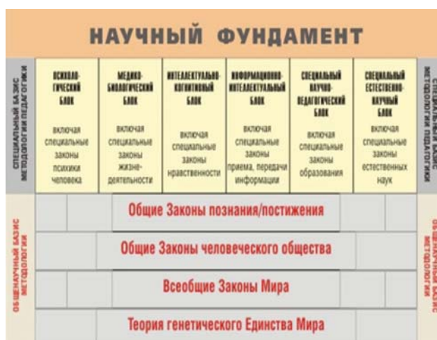
Обозначения: ОЗПП – общие законы познания и постижения, СЗПЧ – специальные законы психики человека, ОЗН – общие законы нравственности, СЗУШ – специальные законы управления школой, СЗО – специальные законы образования, ОЗО – общие законы человеческого общества.

истине общественных идеалов, ценностей, духовно-нравственных выборов, мыследеятельности, жизнедеятельности. Открывается глубоко спрятанный в человеке аксиологический (целевой) потенциал жизни. Вместо блуждания во мгле появляется «вектор» развития человека и общества. Вместо отчаяния появляется «маяк», указывающий направление развивающихся возможностей человека. Вместо ощущения пустоты жизни появляется цель развития потенциала нравственной личности. Так система образования на основе законов человеческого общества вновь обретает возможность стать социально значимой – владеющей ценностью научения смыслам жизни, а потому и стратегически важной системой духовно-нравственного воспитания человека.