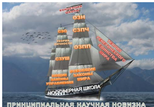
Рис. 2. Научный фундамент образования XXI в. [12; 69]

возможности поставить систему образования на научный фундамент, включающий общенаучный и специальный научно-педагогический базис. Сегодня образование России получило потенциал для начала процессов реинжиниринга – практической замены ведущих механизмов системы с целью её эволюционирования. Рассмотрим составные части научной платформы ноосферного образования.