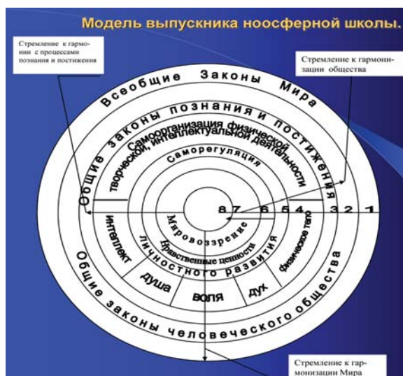
Рис. 5. Модель выпускника школы (по Н.В. Масловой и А.Г. Юраш) [13; 15]

Общество вступило в исторически новый этап эволюции образования. Этот этап назван ноосферным (от греч. noos – ум, разум), поскольку роль одухотворённого разума, постигающего единство и присущие Миру естественные Законы, неизмеримо возрастает. Ноосферный этап имеет особую миссию: ввести в научно-образовательный оборот системнономию – интегрированный научный подход, организующий взаимосвязанные системы естественных законов Мира, общества, человека.