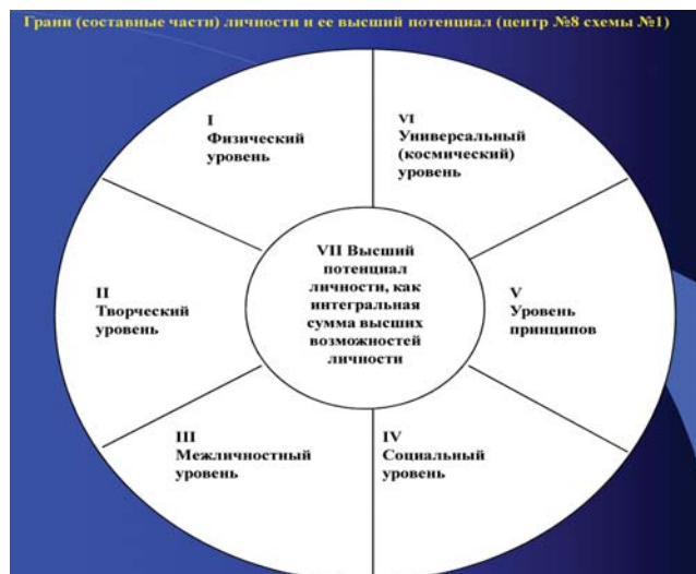
Рис. 4. Ядро модели выпускника школы (по Н.В. Масловой и А.Г. Юраш) [12]

(планетарно-космической) теории личности. Периодическая системы законов психики человека позволяет создать модель выпускника ноосферной школы (рис. 3). В центре схемы расположен Высший потенциал ученика как интегрированная сумма всех позитивных возможностей его личности. Отдельные грани личности – суть следующие: физическое, творческое, межличностное, социальное, принципиальное, мировоззренческое развитие личности. Это модель личности вне окружающей среды. Практическая работа автора со школьниками и учителями, показывает их безграничные возможности. На следующей схеме (рис. 5) ядро личности выпускника (сфера первого порядка) размещено в среде мировоззрения (сфера второго порядка) и нравственных ценностей (сфера третьего порядка). Они заключены в сферу личностного развития, инструментом которого выступает саморегуляция человека. В кольце пятого порядка – интеллект, воля, душа, дух, физические возможности как сферы саморегуляции личности. Сфера 6-го порядка символизирует законы познания/достижения. Это область ноосферной гносеологии, открывающей путь к системам специальных законов образования [11], здоровья [5], психики человека [1]. Все они входят в сферу законов человеческого общества. Объединяющей является сфера Всеобщих Законов Мира .