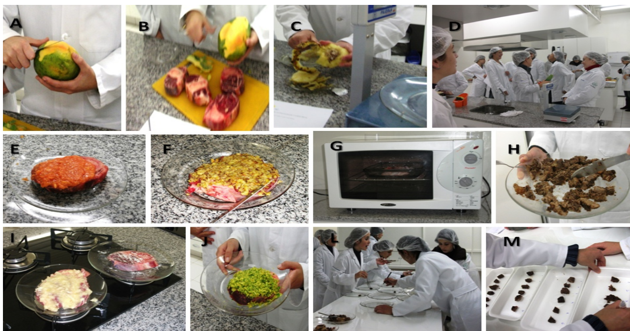
Figura 3. Fotos exemplificando as etapas da prática: A, B e C demonstram os alunos preparando seus homogeneizados; D demonstra o grupo de alunos nos momentos iniciais da prática; E, F, I e J demonstram os tratamentos em repouso; G demonstra o método de preparo; H e M demonstram a preparação para análise sensorial e L demonstra o comportamento dos alunos ao prepararem o material para a análise sensorial nas etapas finais da prática.

equipamentos (balança de precisão e liquidificador) eram suficientes para que cada grupo realizasse seu procedimento sem aguardar o outro, o que facilitou com grande relevância a execução da prática. Neste momento poucas observações foram levantadas pelos alunos e as dúvidas se concentraram no aceite do ponto do homogeneizado pelos professores (Figura 3).