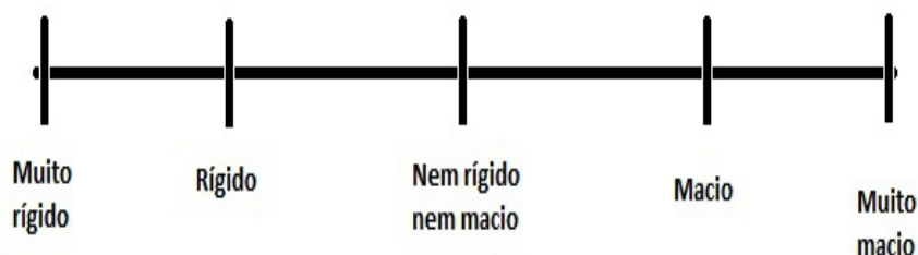
Figura 1. Modelo da tábua de avaliação sensorial construída pelos alunos.

É importante a realização das avaliações através da metodologia de ensaios controlados em que apenas os avaliadores (alunos que realizaram os experimentos e professores envolvidos na aula) saibam o que cada amostra contém, pois se comentários sobre o procedimento forem levantados, influenciaremos as respostas invalidando o procedimento.