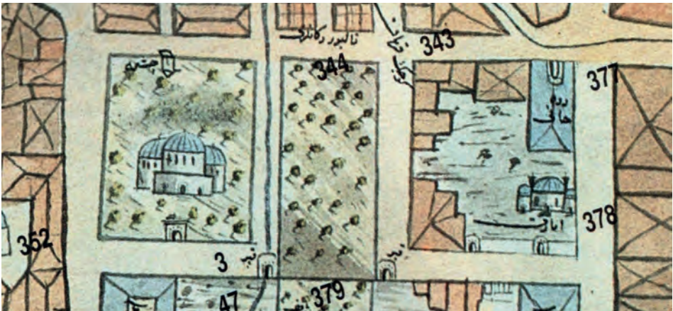
Resim 6. II. Bayezit Suyolu Haritasında Fatih Darüşşifası.