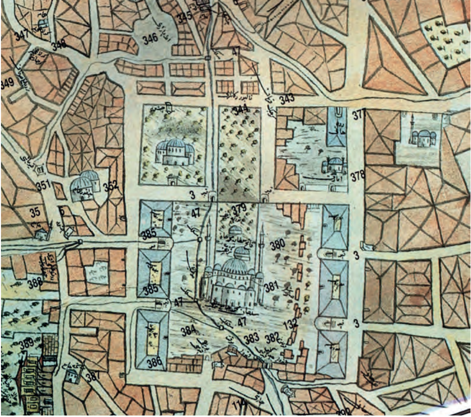
Resim 5. II. Bayezit Suyolu Haritasında Fatih Külliyesi.