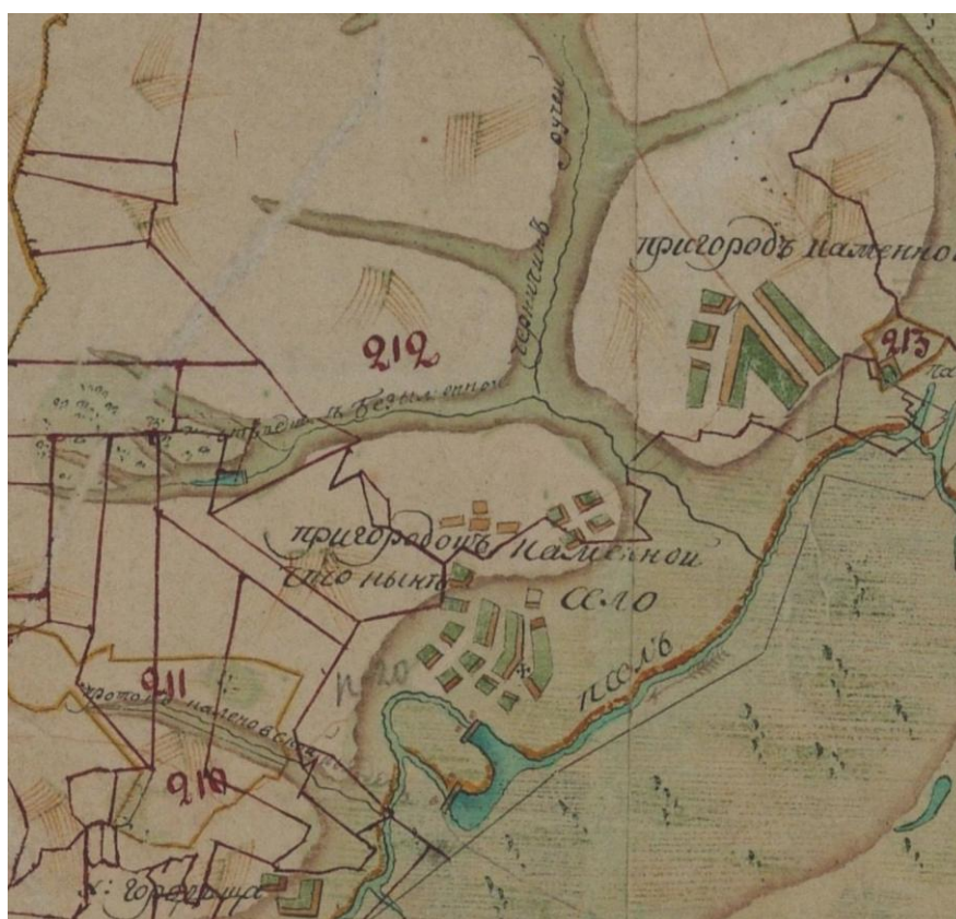
Рис. 2. Село Пригород Каменный на «Плане Генерального межевания»

После подписания Поляновского мира в 1634 г. по инициативе князя Л. Жулкевского на Новом городище был построен острог. Под руководством Петра Чаплинского были построены укрепления, подвезены припасы и артиллерия. Новый город получил имя Гадяч. Очень быстро он становится одним из военно-административных центров Среднего Псла [6, с. 322].