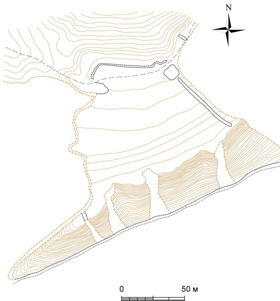
Рис. 3. План замка крепости Каменное

Высота над уровнем реки составляет около 40 м. Размеры замка невелики – 85х55 м. С южной стороны он защищён крутым каменистым склоном коренного берега Псла. Склон изрезан оврагами, в некоторых местах на поверхность выходят залежи железистого песчаника. С плато останец соединяется узким перешейком. В этом месте замок укреплён валом высотой до 2 м с полукруглым выступом-ронделем. Восточная сторона защищена рвом шириной 2-3 м и глубиной 1 м. В юго-западной части, ниже уровня площадки городища, находятся остатки рва шириной 5-6 м и глубиной до 3 м. В этом месте склон горы уничтожен карьером. Не исключено, что ров защищал всю западную сторону городища. В северо-восточной части расположен вал, пересекающий узкий перешеек, связывающий останец с соседним мысом. Ширина вала составляет 2 м, высота – 1 м [8, с. 207].