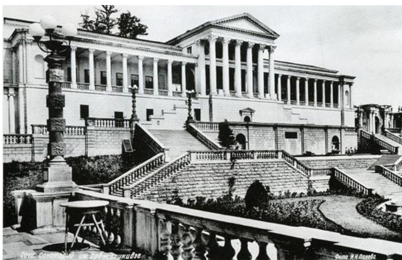
Рис. 1. Санаторий им. С. Орджоникидзе 1934–1937 гг., архитектор И.С. Кузнецов

Все это было сделано не случайно, т.к. положение в сочинских санаториях с продуктами питания было чрезвычайно сложным. Отдыхающим предлагали по выбору только два блюда. Качество продуктов питания не всегда было на должном уровне, часть продуктов повара здравниц сами покупали на рынках города и у населения. С целью улучшить рацион питания отдыхающих санаторий был вынужден ввести свое собственное подсобное хозяйство.