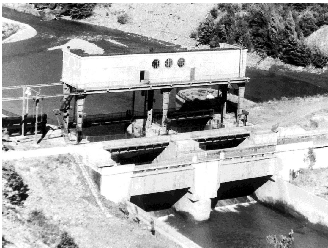
Рис. 1. Строительство Краснополянской ГЭС

Свое отношение к немцам население вслух не высказывало, хотя душевная боль ни на секунду не отпускала» [1].