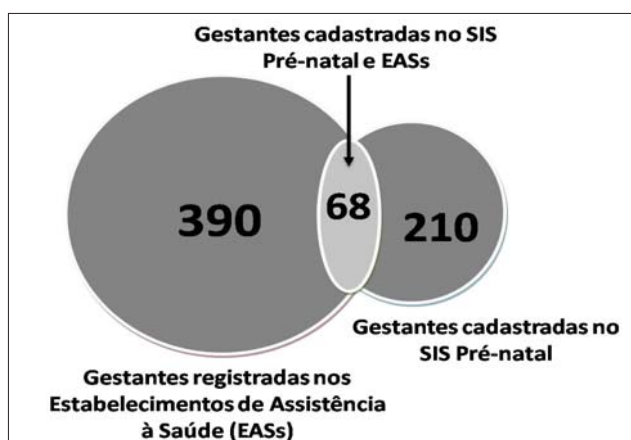
Figura 1. Relação entre número de gestantes cadastradas no SIS Pré-natal e nos Estabelecimentos de Assistência à Saúde em um município paulista, 2007.

O principal problema encontrado foi o subregistro e a má qualidade dos prontuários das gestantes. Pelo fato de estarem misturados a outros arquivos, era difícil o acesso a eles. Muitos prontuários estavam incompletos, sem anotações das consultas, ausência de dados sobre a saúde da gestante - como idade gestacional e data provável do parto, dados pessoais incorretos,