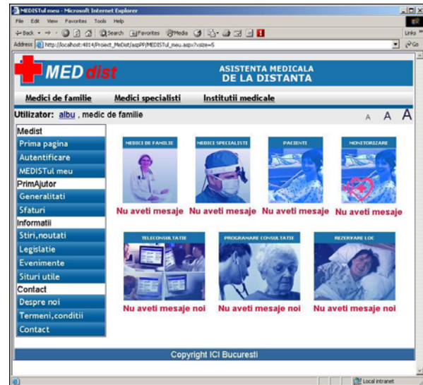
Figura 4. MEDISTul personal – medic

De subliniat faptul că au fost folosite butoane-imagini pentru a face mai intuitiv scopul acestora, dar totodată s-a furnizat și textul alternativ pentru asigurarea accesibilității.