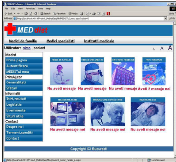
Figura 3. MEDISTul personal - pacient

În figurile 3-4, se poate vedea conținutul paginii MEDISTul personal pentru cele 2 tipuri de utilizatori principali considerați: pacienți și medici.