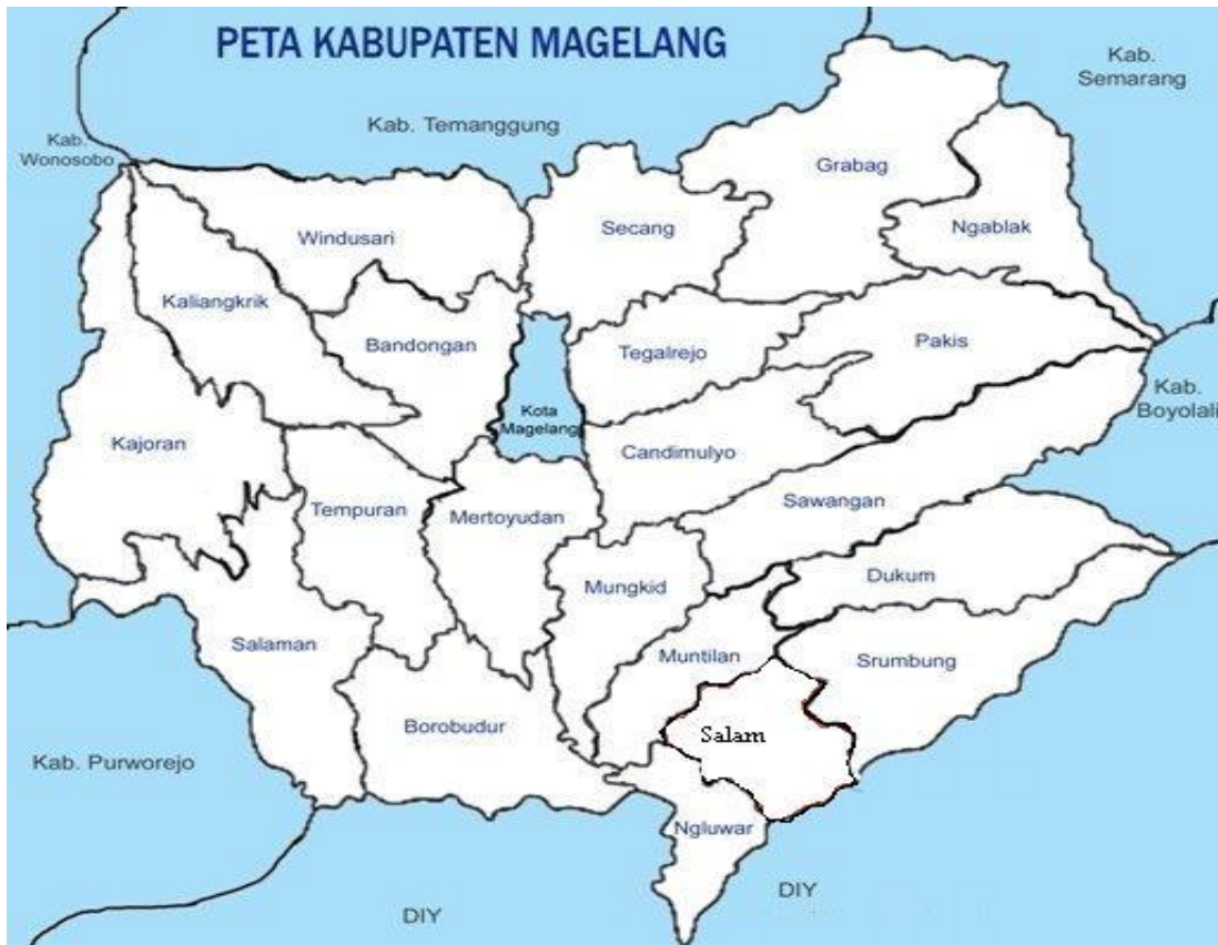
Gambar 2. Peta Kabupaten Magelang

yang melimpah. Penataan ruang Kabupaten Magelang sangat memperhatikan pelestarian fungsi wilayah sebagai daerah resapan air, di antaranya dengan mengembangkan sentra agribisnis berbasis pertanian (Handari et al , 2012).