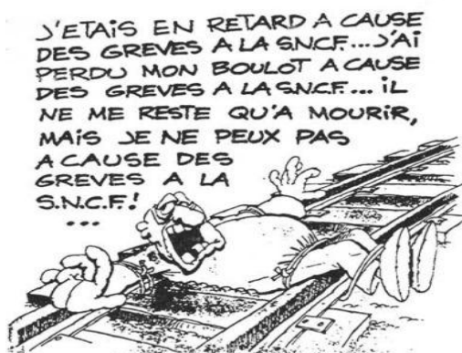
La greve des transports