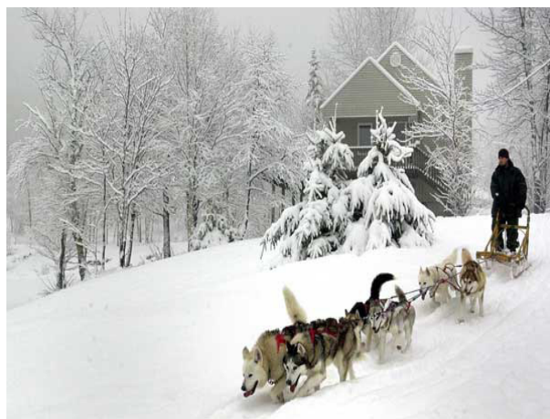
Comment se déplace-t-on en Sibérie?