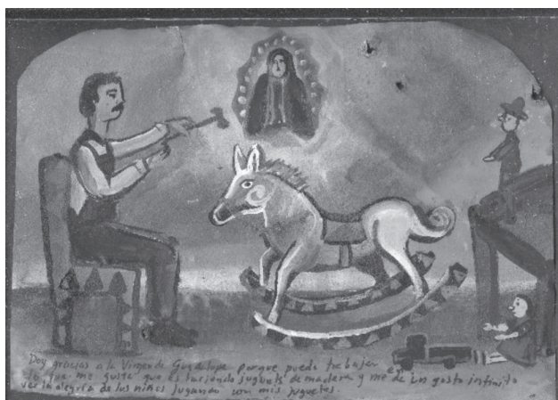
Figura 7. "Doy gracias a la Virgen de Guadalupe porque puedo trabajar en lo que me gusta que es haciendo juguetes de madera y me da un gusto infinito ver la alegría de los niños jugando con mis juguetes."

En el caso del exvoto, y de todo aquello que conjuga dos niveles de discurso (visual/verbal) la situación se complejiza. Existe el anclaje verbal (la explicación del milagro) y la representación visual.