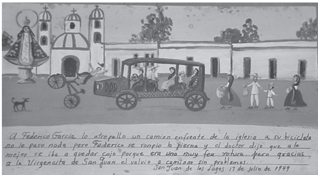
Figura 8. Obra sin título.

Es indudable que en la creación de un exvoto convergen actos de fe, cuya filiación es infinita. También es posible, a través de su recorrido, que se antoja cronológico o temático, dar cuenta de las preocupaciones, angustias y motivos de agradecimiento de los mexicanos. Sin duda alguna se trata de materiales que representan un modo de creer y vivir la religión cató-