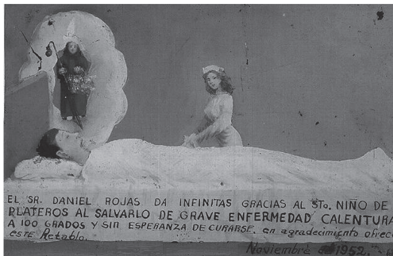
Figura 2. Obra sin título.