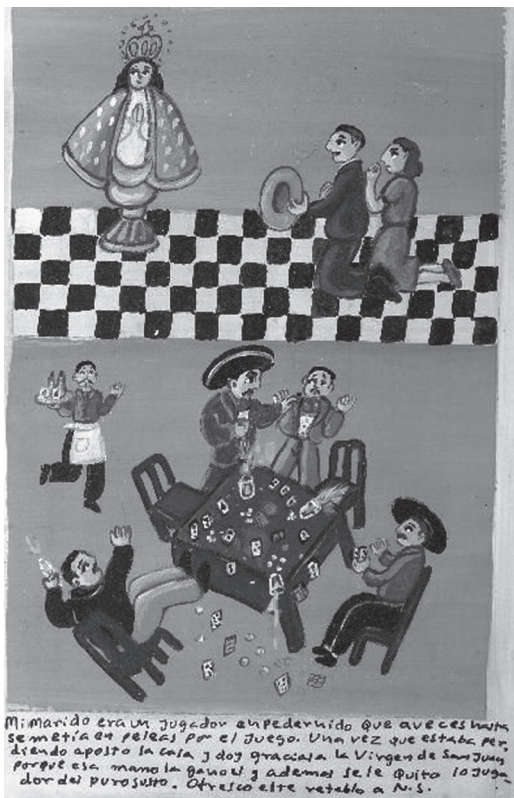
Mi marido era un jugador empedernido que a veces hasta se metía en peleas por el juego. Una vez que estaba perdiendo apolto la casa y doy gracias a la Virgen de San Juan porque esa mano la gané y además se le quitó la jugada del puro susto. Ofrecí este retablo a N.S.

Estar en lugar de otro, es decir, estar en tal relación con otro que, para ciertos propósitos, sea tratado por ciertas mentes como si se fuera ese otro. Consecuentemente, un vocero, un diputado, un apoderado, un agente [...] todos representan alguna otra cosa, de diversas maneras, para mentes que así lo consideran (Peirce, 1986).