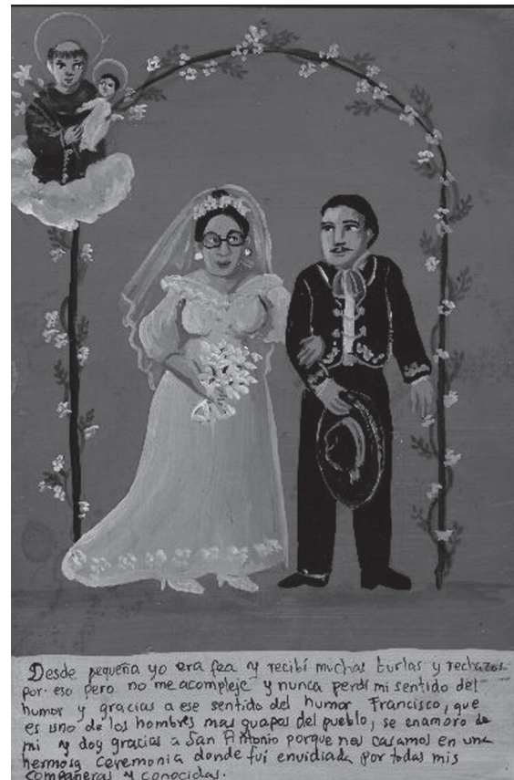
Figura 1. Obra sin título.

El signo es cualquier elemento (una imagen, un sonido, etcétera) al que los humanos hemos atribuido un significado. O, dicho de otro modo, un elemento que sustituye a otro. Para Ferdinand de Saussure un signo está compuesto por dos partes: el significante y el significado. En este sentido, entendemos que el