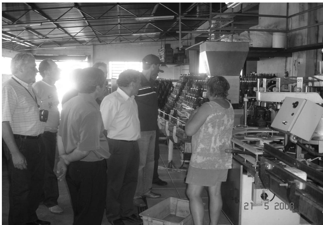
Figura 3 - Visitações de membros da Rota das Salamarias em outras experiências mercantis de agrupamentos de produtores rurais na Região Colonial do RS, processo esse que revela difusão, intercâmbio e produção coletiva de conhecimentos.

Em entrevistas com produtores pudemos perceber que houve e continua a haver parcerias com outros roteiros turísticos e de gastronomia étnica da região, em particular, a rota do Caminhos de Pedras e a do Vale dos Vinhedos, ambas de Bento Gonçalves. A intenção dessa prática é de “trocar idéias e experiências, participar de palestras, capacitar empreendedores”, relata em entrevista um membro da Rota das Salamarias.