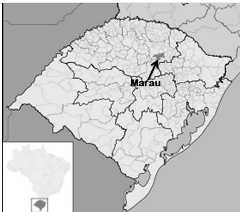
Figura 1 - Localização do município de Marau no estado do Rio Grande do Sul.

grupos no meio rural tendem, de uma forma ou de outra, reproduzir-se com redefinições. Por isso que a manutenção de fatores ligados à tradição do cotidiano da vida do agricultor familiar é um elemento de atração e de otimização no interior da referida rota. Os produtos artesanais (vinho, salame, queijos, em particular), a gastronomia (os restaurantes “típicos”, os “cafés coloniais”), o turismo aquático, a venda e visitação da produção de erva-mate, dentre outros, são os pontos de grande expressão.