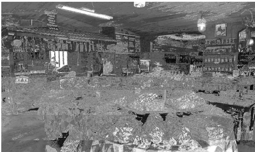
Figura 4 - Cantina da Terra, em Marau; seu acervo de oferta, em sua grande maioria, são produtos da agroindústria familiar local e regional, mas principalmente da Rota das Salamarias.

Para promover a ligação mais efetiva entre a produção e a comercialização, além de feiras e de vendas diretas nas propriedades e/ou encomendas, há um centro de vendas de produtos da referida rota, denominado de Cantina da Terra, logisticamente situado na margem da RS 324, no interior do perímetro urbano de Marau.