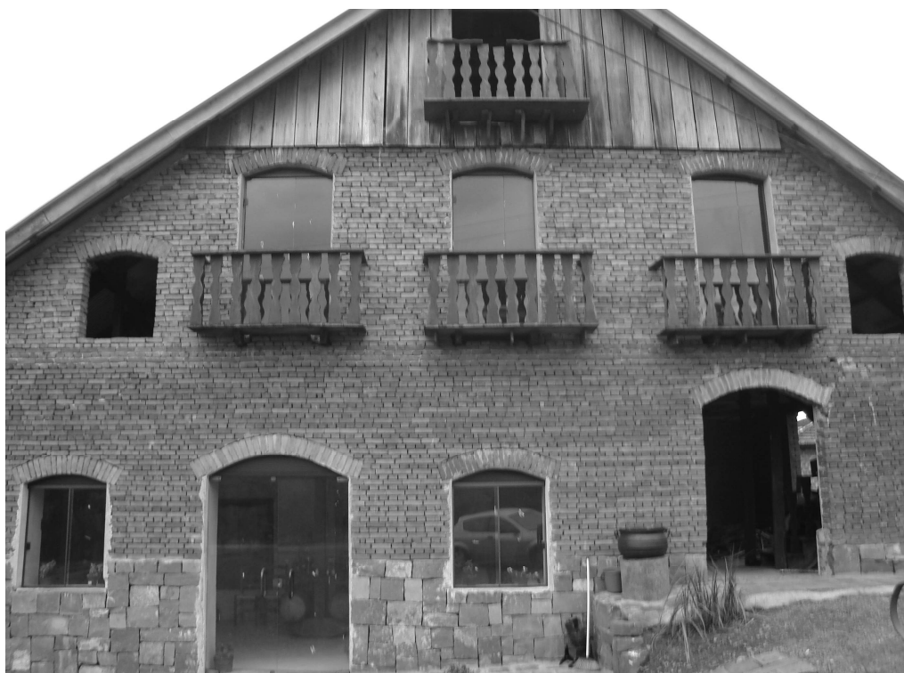
Figura 5 - A parte de frente da cachaçaria e agroindústria de produtos derivados da cana e da uva no interior da Rota das Salamarias; a construção conserva características da habitação antiga da família que, segundo o proprietário, é uma réplica da casa que seu avô possuía “antigamente na Itália”.