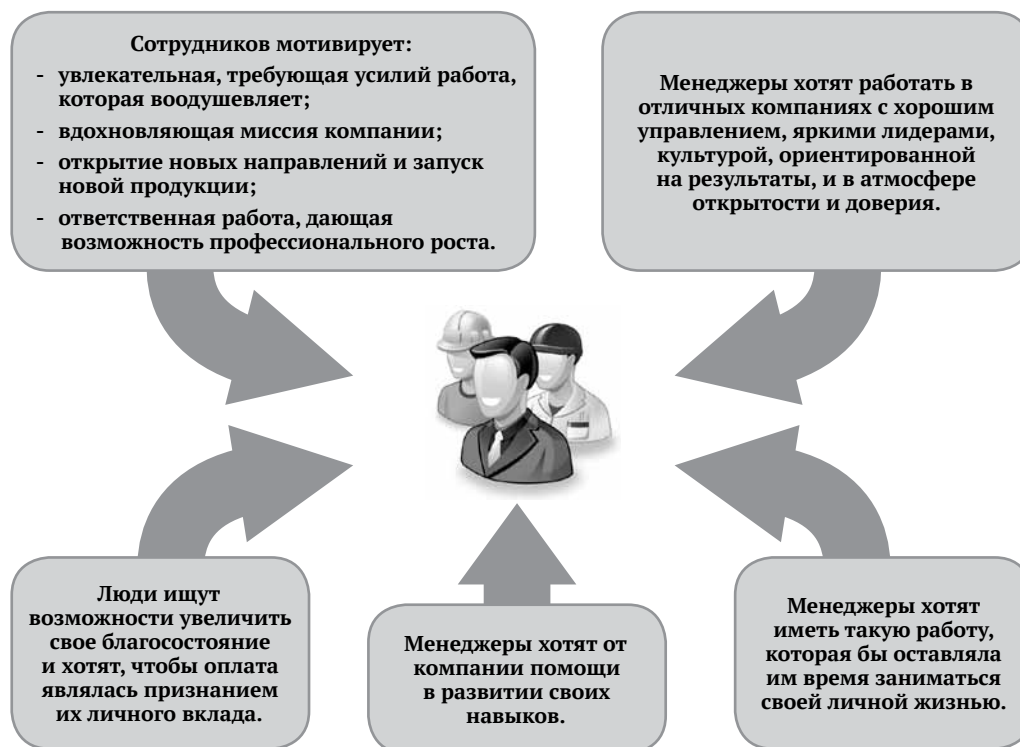
Рисунок 4 – Пять составляющих ценностного предложения для сотрудников

Ценностное предложение включает пять составляющих (рис. 4 [составлен авторами по результатам исследования]).