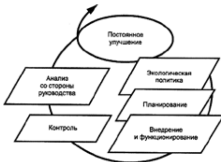
Рисунок 1 – Модель системы экологического менеджмента

Вступление России в ВТО ставит российский бизнес в достаточно узкие временные границы, за которые компании должны успеть перестроить свою деятельность. Для повышения конкурентоспособности и возможности эффективно взаимодействовать с зарубежными компаниями, организациям России необходимо в кратчайшие сроки освоить и внедрить современные модели и методы ведения хозяйственной деятельности. Последние тенденции увеличения внимания государственных органов РФ к проблемам экологии, а также всеобщая концепция устойчивого развития позволяют нам утверждать, что основным инструментом повышения конкурентоспособности российских компаний может выступить экологический менеджмент. Основная направленность экологического менеджмента, которая проявляется в обеспечении охраны окружающей среды и предотвращении ее загрязнения в балансе с удовлетворением социально-экономических потребностей, в совокупности с моделью построения бизнеса, направленной на постоянное улучшение (рис. 1 [3, с.4]), способны в кратчайшие сроки помочь перестроить деятельность российских компаний в соответствии с мировыми тенденциями развития бизнеса.