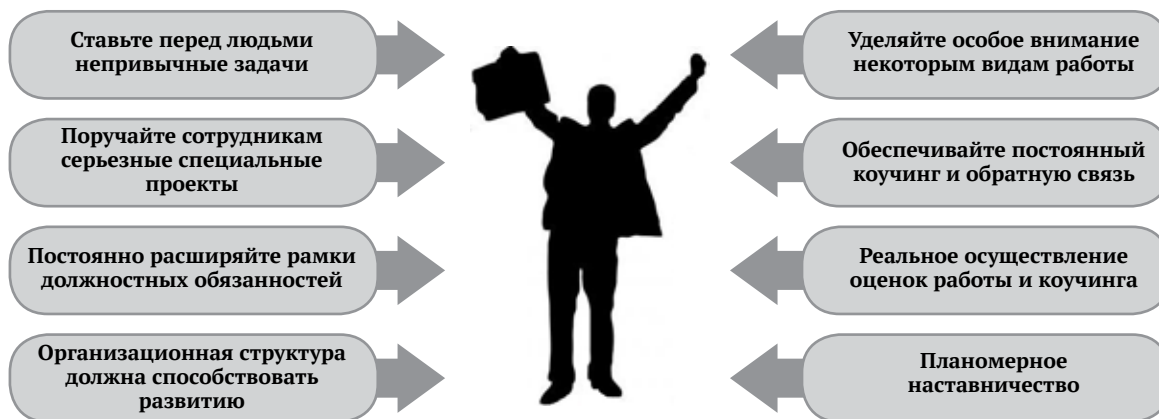
Рисунок 5 – Инструменты непрерывного развития потенциала сотрудников

Как отмечалось выше, уровень экологического образования в России находится в зачаточном состоянии. Переобучение сотрудников новым эколого-ориентированным основам ведения хозяйствования ложится полностью на плечи руководителей структурных подразделений компаний. При этом, чем быстрее сотрудники сами начнут принимать экологически верные решения, тем быстрее они поймут эффективность систем экологического менеджмента. Для достижения данной цели менеджмент таланта предлагает использовать следующий набор инструментов, который направлен на раскрытие потенциала сотрудников и на их непрерывное развитие (рис. 5, составлен авторами по результатам исследования).