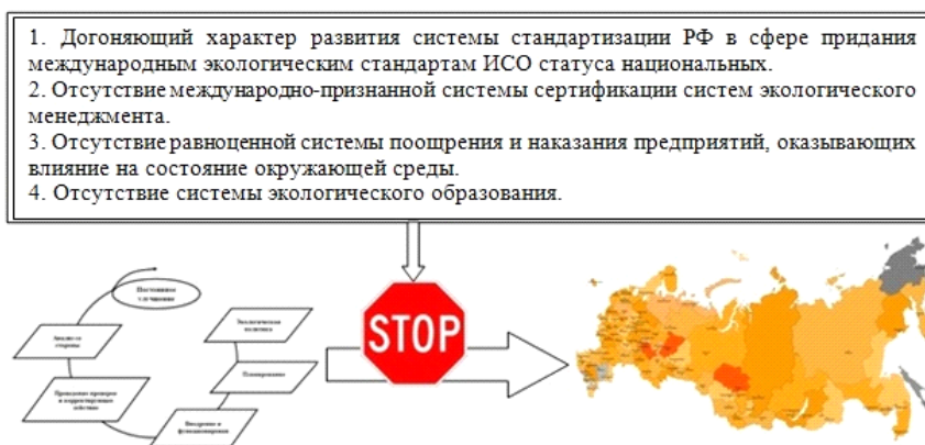
Рисунок 2 – Проблемы внедрения систем экологического менеджмента в России

Внедрение систем экологического менеджмента в России испытывает ряд проблем (рис. 2 [1, с. 45]).