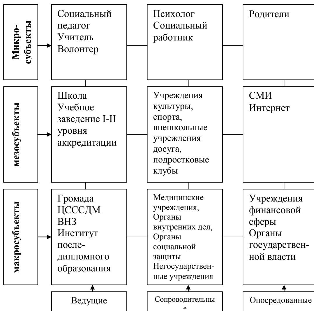
Рис. 1. Субъекты системы профилактики аддиктивного поведения детей

Предлагаем рассмотреть субъектную инфраструктуру системы профилактики аддиктивного поведения детей при помощи следующей схемы.