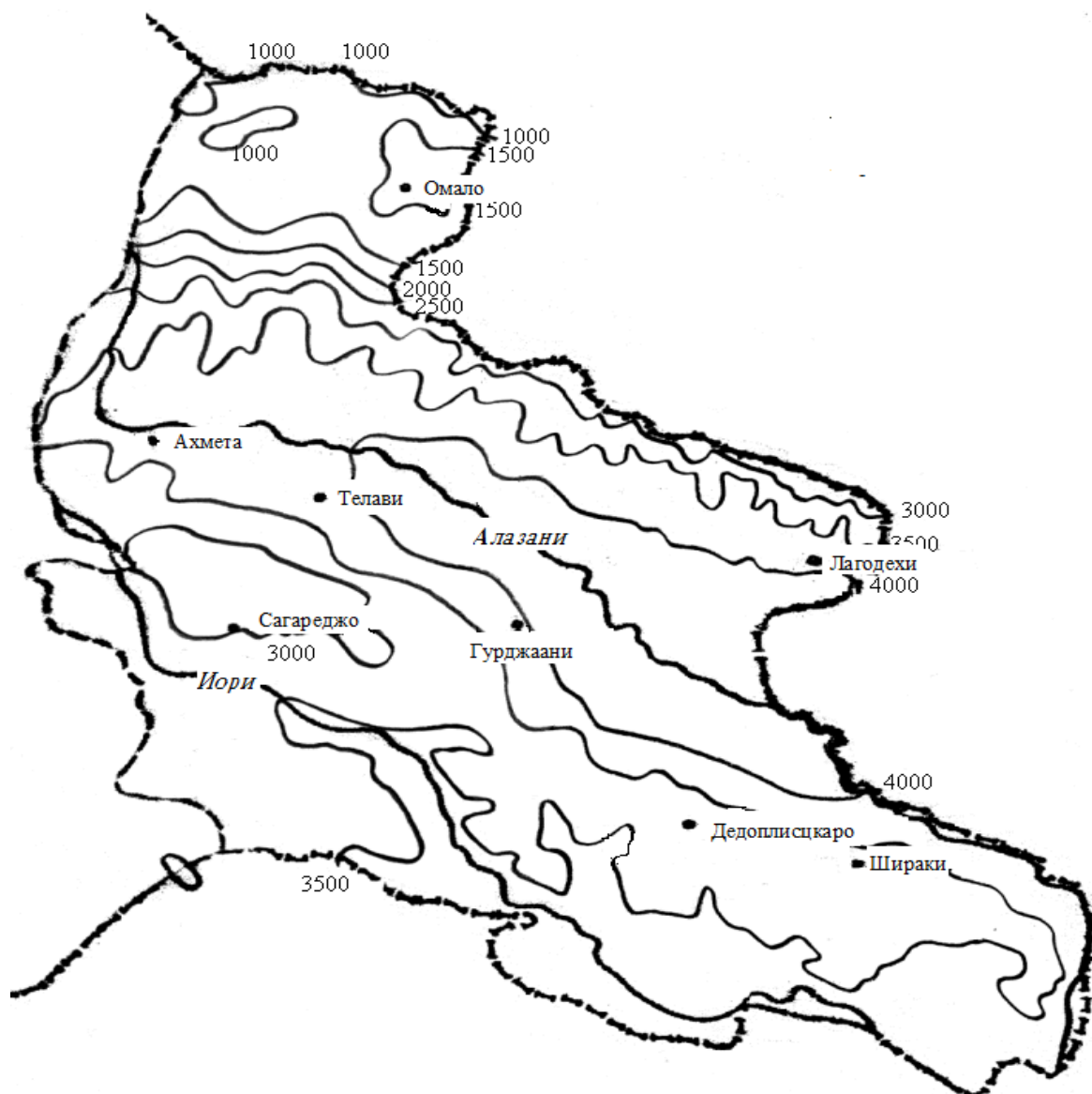
Рис. 1. Сумма активных температур выше 10^{\circ}

Изолинии представленные на карте изображают средний многолетний режим активных температур. Из года в год их значение так же, как любые характеризующие признаки климата, испытывает колебание. Это ясно видно из таблицы 1, в которой представлены суммы активных температур различной обеспеченности.