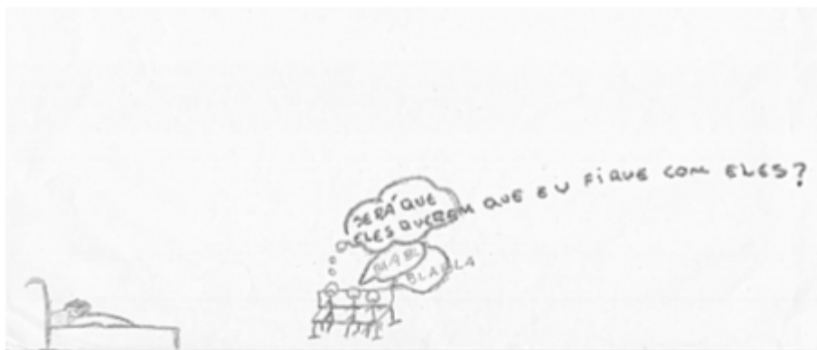
Figura 4. Desenho-Estória com Tema.

relação ao ambiente, tristeza e introspecção, características que remetem à esfera psicoafetiva.