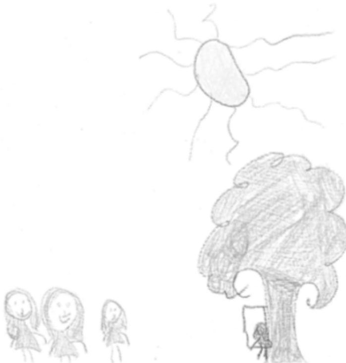
Figura 1. Desenho-Estória com Tema.

Estória: “A menina está com depressão, aí as amigas dela nem percebe aí não vão conversar com ela, daí ela começa a melhorar da depressão.”