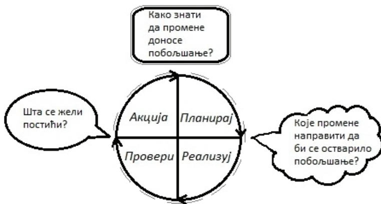
Слика 2. Модел унапређења процеса

Преко ланца реакције унапређеног квалитета Деминг је утврдио везу између побољшавања квалитета производа и повећања профитабилности компанија. 10 Под сталним побољшањима менаџмента квалитета треба подразумевати континуирано унапређење укупних перформанси грађевинске организације.