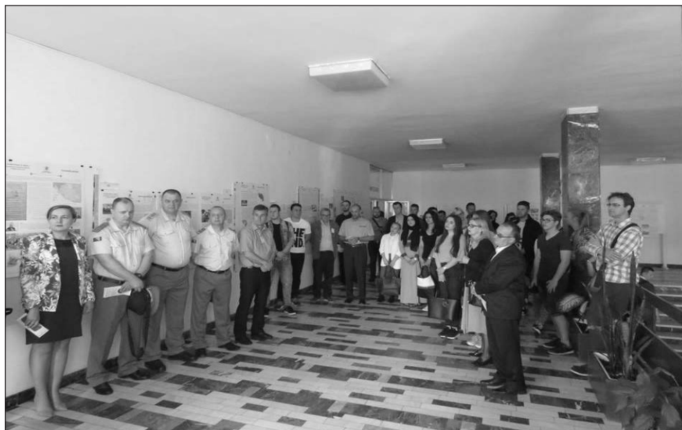
Prilog 2. Detalj sa otvaranja izložbe “Domovina u srcu”, Tuzla, 22. maj 2018.