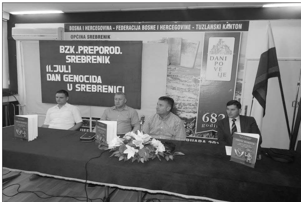
Prilog 3. Promocija monografije “Drugi korpus Armije Republike Bosne i Hercegovine 1992-1995”, Srebrenik, 5. juli 2018.