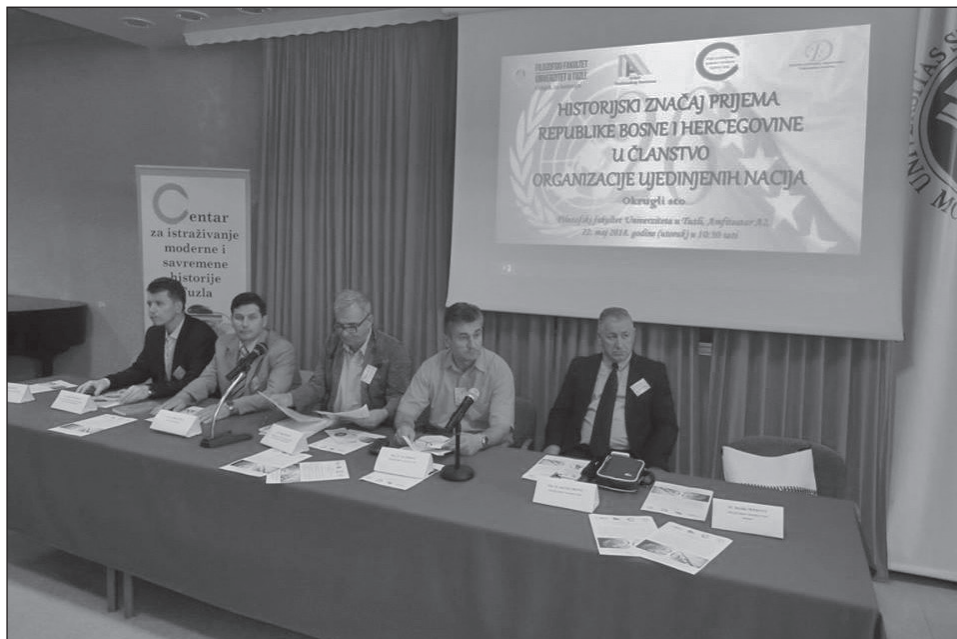
Prilog 2. Učesnici/izlagači na okruglom stolu „Historijski značaj prijema Bosne i Hercegovine u OUN“.

Ovim okruglim stolom iznesena su mišljenja i stavovi istaknutih naučnika i univerzitetskih profesora o pitanju prijema Bosne i Hercegovine u UN, te se naglasio značaj obilježavanja datuma, koji su za Bosnu i Hercegovinu od historijskog značaja. U konačnici, svrha održavanja okruglog stola bila je da se ne zaborave važni datumi koji su obilježili historiju Bosne i Hercegovine, a sve u cilju da se podigne svijest široj društvenoj zajednici i posveti značajnija pažnja ovom važnom segmentu historije Bosne i Hercegovine. Opravdanost se ogleda u činjenici da se uz pomoć organiziranja ovakvih okruglih stolova animira šira društvena zajednica, stručna, naučna i kulturna javnost, te razvija svijest kod studenata i građana, odnosno šire društvene zajednice, o značaju obilježavanja historijskih datuma važnih za očuvanje historijske posebnosti Bosne i Hercegovine. Okrugli sto zasigurno je opravdao očekivanja organizatora i učesnika, a za naredni period je najavljena realizacija i drugih sličnih projekata.