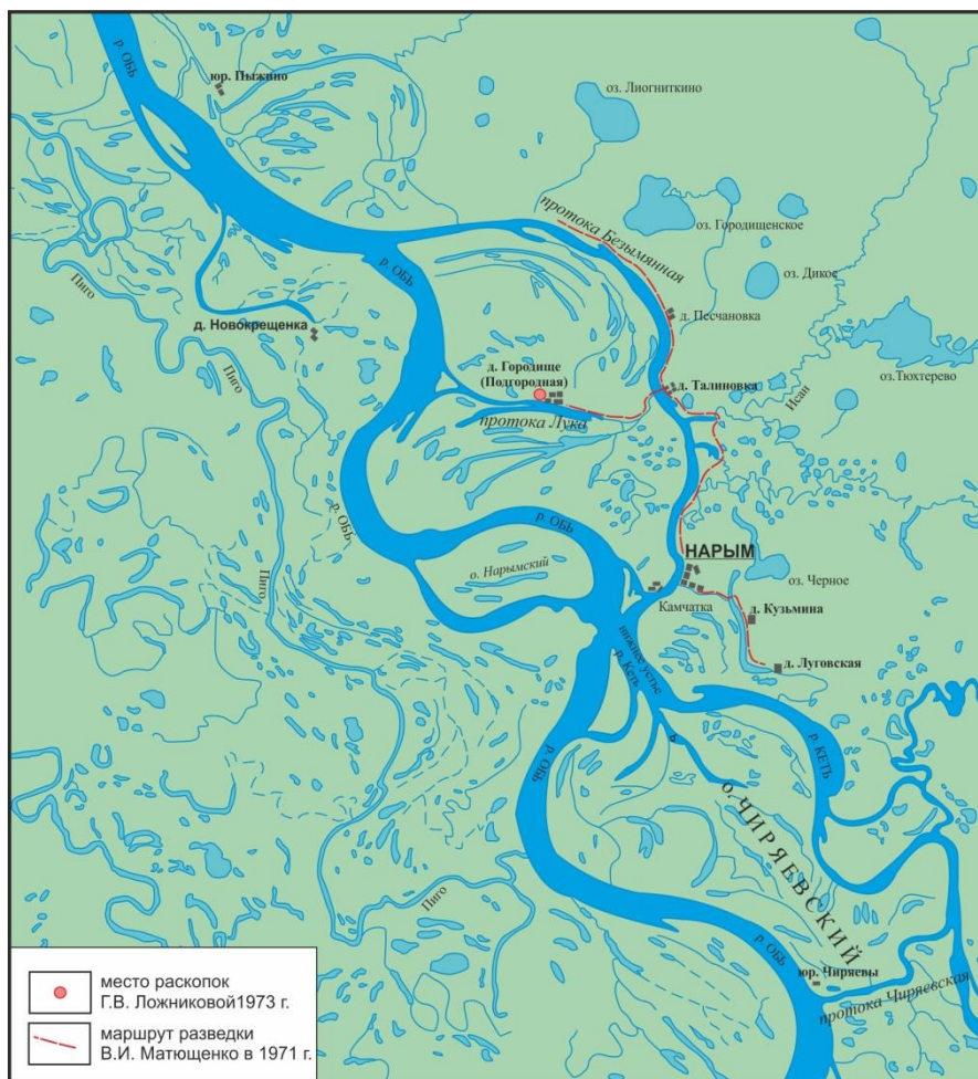
Рис. 1. Карта окрестностей Нарыма

Схожая ситуация и с установлением местоположения первого Нарымского острога. Согласно Г.Ф. Миллеру, изначально он располагался в 16 км ниже современного ему города Нарыма, в месте известном под названием «Старое городище» (Миллер, 2005: 297). П.Н. Буцинский считал эту гипотезу ошибочной и соотносил «Старое городище» с деревней Городищенской, которая располагалась к северо-западу от пос. Нарым (Рисунок 1) (Буцинский, 1999: 96). На топографических картах в хронологической ретроспективе этот населенный пункт фигурировал также под названиями «Городище», «Подгорная». Предания о том, что на месте деревни Городищенской располагался Нарымский острог, бытовали среди окрестного населения еще в середине XX в. и зафиксированы исследователями (Баронас, 1964: 53).