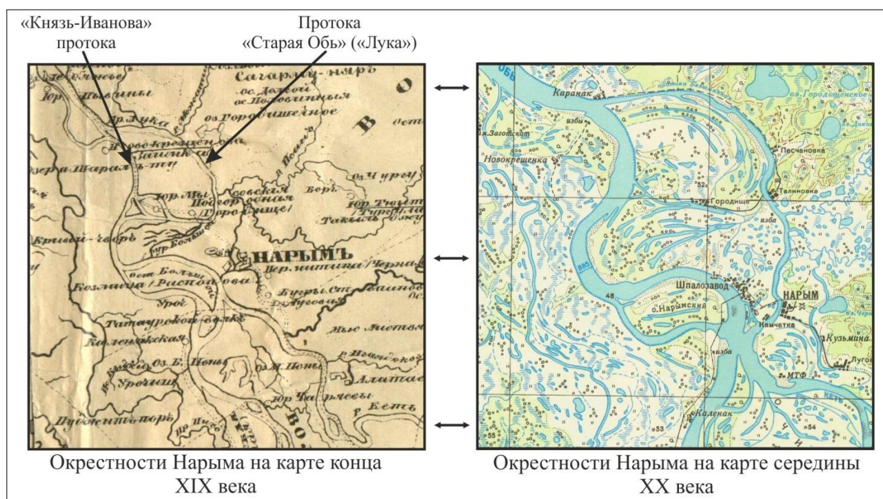
Рис. 2. Изменение гидрологической ситуации в месте расположения д. Городище

Для ответа необходимо определиться с главными ориентирами Г.Ф. Миллера и локализовать их на современной карте. «Князь-Иванова» протока часто упоминается в литературе: о ней сообщал Н. Спафарий, проследовавший через Нарым в середине XVII в.; отметил на «Чертеже Нарымского города» С.У. Ремезов; одноименный «рыболовный песок» был известен даже в XIX в. По сведениям А.Ф. Плотникова, «Князь-Ивановский песок» получил свое название по имени владевшего им князя Ивана Кичеева. По преданию рода Кичеевых, Ванга Кичей, бывший еще язычником, оказал русскому царю какую-то важную услугу; в 1602 г. он ездил в Москву и был пожалован в вечное владение многими рыболовными местами. Среди них был и будущий «Князь-Иванов песок», расположенный недалеко от Нарыма, который в XIX в. стал объектом беспрестанной дележки между инородцами Ниже-Подгородной волости и крестьянами д. Городищенской (Плотников, 1901: 174). Таким образом, не приходится сомневаться в том, что эта протока существовала. Ее отсутствие на современных картах объясняется изменением гидрологической ситуации в пойме Средней Оби, что наглядно демонстрирует сравнительный анализ картографических материалов конца XIX в. и второй половины XX в. (Рисунок 2).