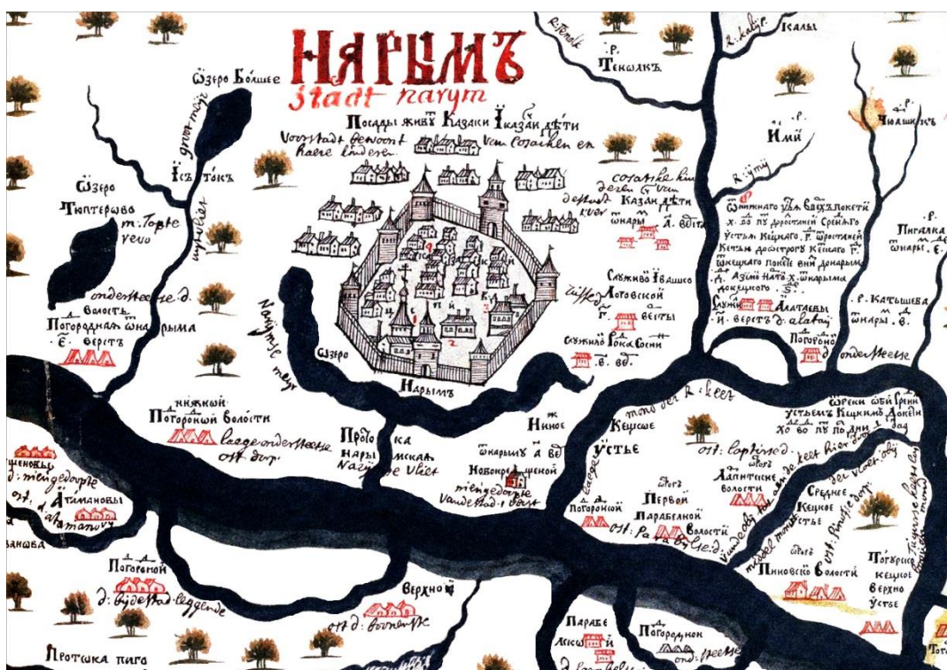
Рис. 3. Чертеж Нарымского города С.У. Ремезова (фрагмент)

Река Кеть соединяется с Обью несколькими крупными и мелкими протоками. Относительно нижнего и верхнего устья никаких сомнений быть не может, поскольку географическая ситуация четырехвековой давности согласуется с современной картой. Нижним устьем является Нарымская протока, верхним – Тогурская. Эта же ситуация была актуальна для конца XIX в. А.Ф. Плотников об устье Кети сообщает: «...Впадает в Обь двумя устьями, кроме других мелких притоков. Первое устье находится выше города Нарыма (по старинному измерению 700 сажеными верстами) в 110 верстах при селе Тогурском; второе устье около Нарыма» (Плотников, 1901: 8). Проблема возникает при определении среднего устья, на роль которого может претендовать несколько крупных рукавов: Чиряевская, Басмасовская, Копыловская и т.д. Чертеж и описания С.У. Ремезова, использованные П.Н. Буцинским, не дают однозначного ответа. В исследованиях XIX в. ни одна из проток не выделяется как среднее устье, все они (кроме Нарымского) считаются «неправильными», потому что некоторые из них, по убыли весенней воды, высыхают, некоторые мелеют (Плотников, 1901: 8; Костров, 1872: 4).