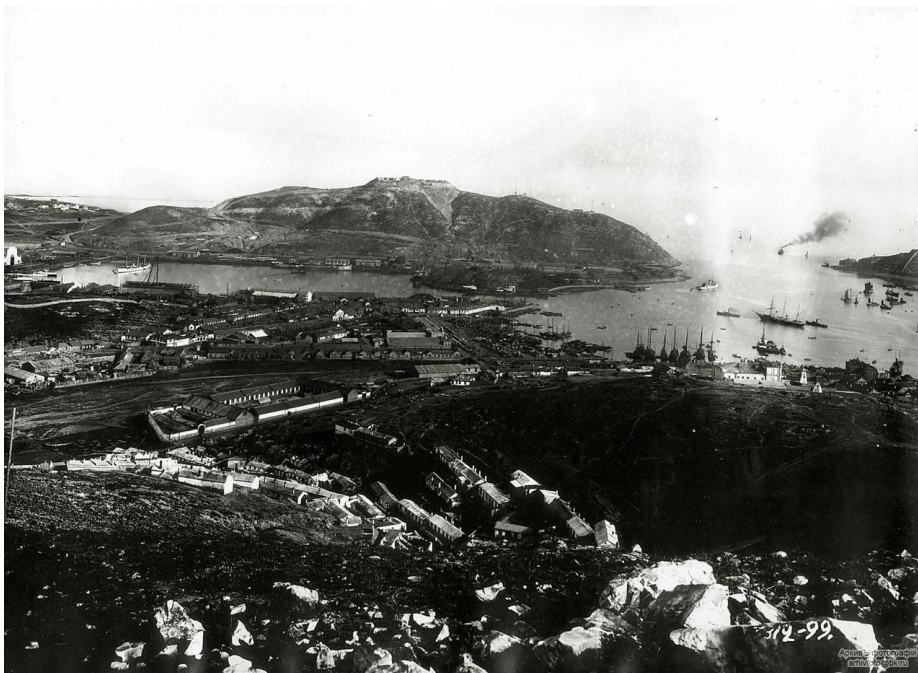
Рис. 2. Порт-Артур – первоклассная незамерзающая морская база с несколькими внутренними акваториями