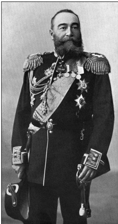
Рис. 1. Адмирал Евгений Алексеев – главный апологет Русско-японской войны

Но возможно ли, чтобы окружение российского императора Николая II, которое инициировало эту войну, ввязалось бы в безнадежную авантюру, каковой на первый взгляд выглядят ее конечные результаты? Возможно ли, чтобы близкий и доверенный императору человек, адмирал Алексеев – главный сторонник войны, настолько переоценил возможности русского флота и столь катастрофически недооценил ту роль, которую предстоит играть военно-морским силам в этой войне?