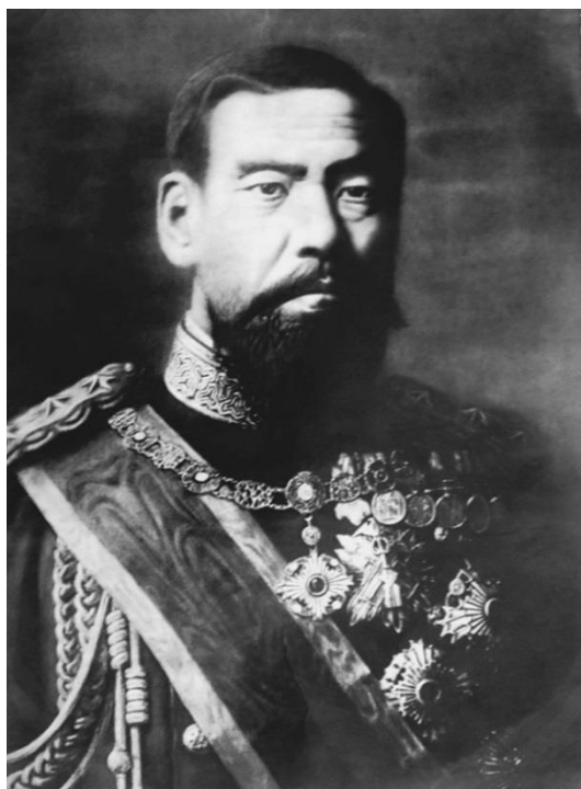
Рис. 3. Император Мейдзи (Муцухито) – монарх-реформатор, превративший Японию из отсталого государства в одну из сильнейших и передовых держав мира