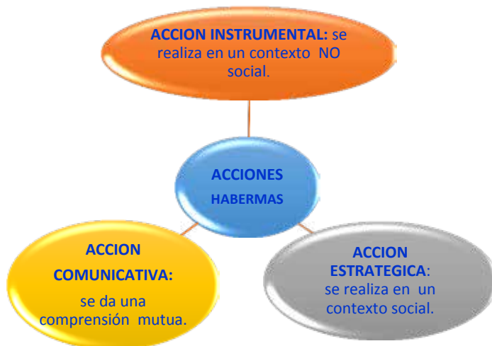
Ilustración 2: Las acciones para Habermas

(Botero, Correa, González, Zambrano, 2014)