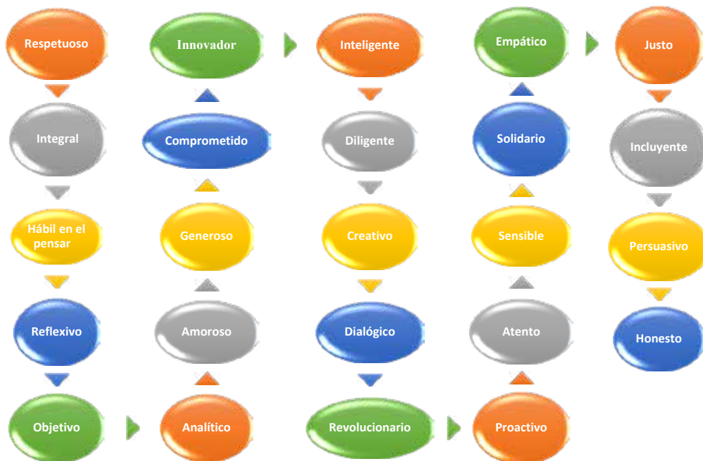
Figura 3: Dimensiones de un docente con pensamiento crítico