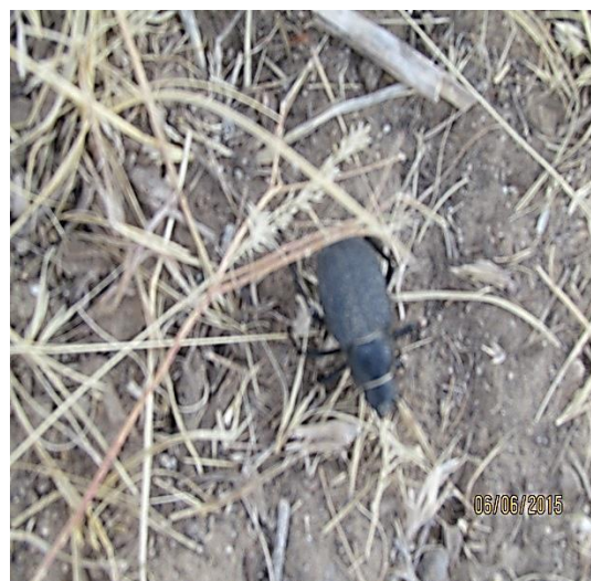
Рисунок 2. Личинки и имаго медляк степной- Blaps halophila F.W.