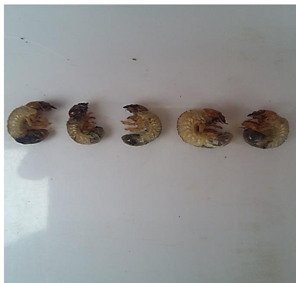
Рисунок 3. Жуки и личинки кравчика черный – Lethrus rosmarus Ball.

Вредные насекомые употребляя в пищу растительную биомассу, снижают продуктивность пастбищ и это обстоятельство требует разработки и обоснованного применения специальных защитных мероприятий.