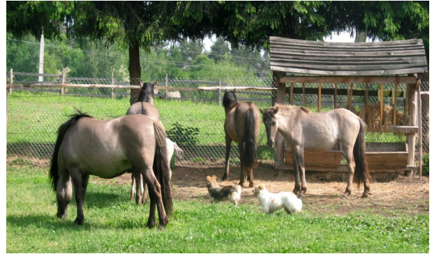
Рис. 1. Коні породи коник польський Fig. 1. Horses of breed horsepolish

характер, ними легко управляти. Рухи швидкі у всіх трьох аллюрах, добре стрибає і скаче галопом. Проте фенотиповий опис забезпечує грубу оцінку середніх значень функційних варіантів генів, присутніх у цих індивідуумів або популяцій. Дотепер основною частиною фенотипів більшості соматичного мутагенезу і, таким чином, з'ясуванням наявності факторів мутагенного впливу на організм, адаптацію організму до певних умов середовища є використання показників цитогенетичної мінливості.