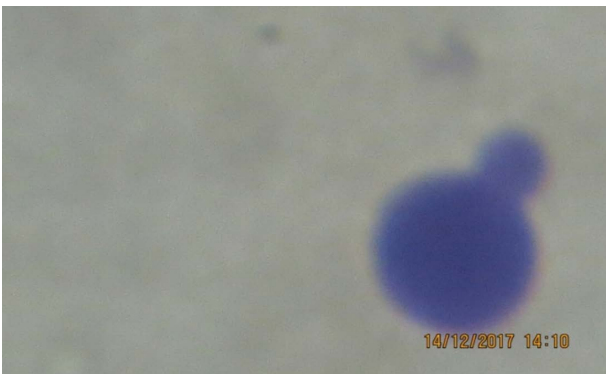
Лімфоцит із мікроядром Lymphocyte with micronucleus