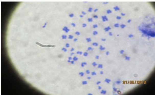
Норма каріотипу, 2n=64. зб. ×1000 The norm of the karyotype, 2n=64. ×1000