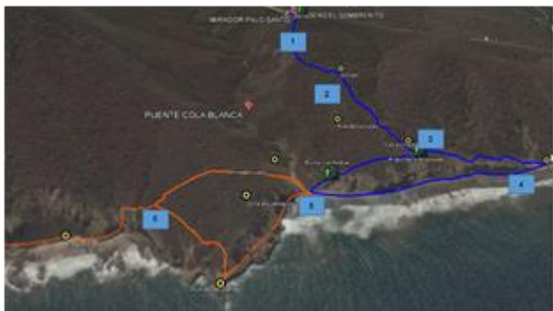
Figura 2. Descripción y ubicación por fracción del sendero ecológico El Sombrerito.

En la figura 2 se representa la ubicación por fracciones del sendero, este fue dividido de manera intangible en fracciones de acuerdo a las rutas establecidas.