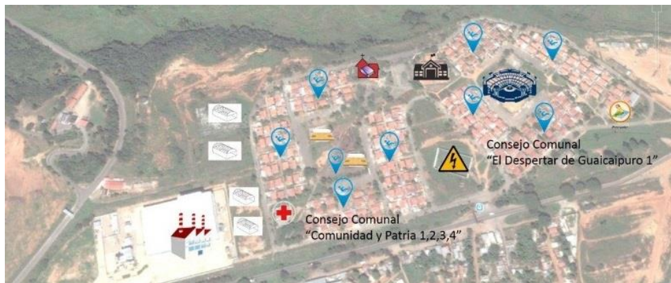
Gráfica 1. Cartografía Social en la comunidad Urbanización Agropecuaria Guaicaipuro, Terrazas 1, 2, 3, 4, 5, 6, 7, 8. Estado Miranda, Venezuela.

Por otra parte, la sistematización , debe trascender hacia la organización y practica coherentes de los hallazgos encontrados con la construcción de los conocimientos de manera colectiva, siendo un elemento primordial para encontrar y aprender de la realidad, con el propósito de transformarla con la obtención de los datos, conocimientos y prácticas. Por otra parte, una vez realizado el proceso de aplicación en la metodología planteada y socialización de los hallazgos y la construcción colectiva del conocimiento, en lo siguiente observaremos algunos ejemplos de Cartografía Social aplicada en el ámbito comunitario: