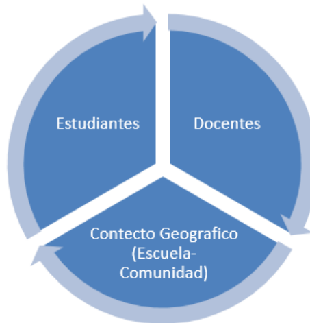
Gráfica 3. Actores de la Cartografía Social en Educación.

Así mismo, en el ámbito educativo se debe identificar los actores en su elaboración, construcción y socialización, que se observa en la gráfica 3 , Actores de la Cartografía Social en Educación.