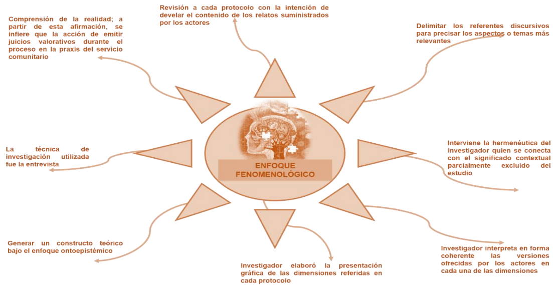
Figura 1. Soporte metodológico