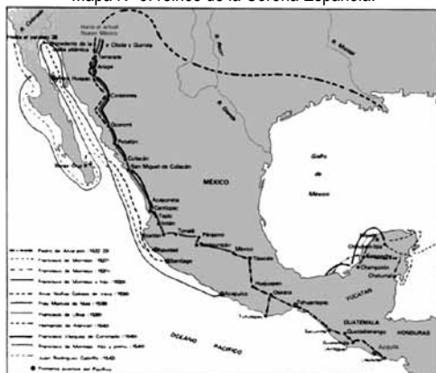
Mapa N° 3: reinos de la Corona Española.