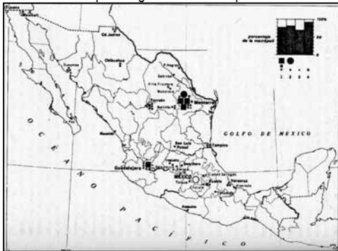
Mapa 2: organización del espacio