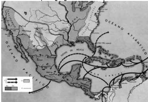
Mapa 1: geografía Nueva España.