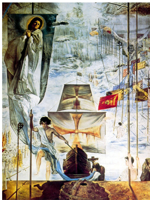
Salvador Dalí. El descubrimiento de América por Cristóbal Colón. (1956-1957) 8

Significa entonces que en la actualidad estamos llamados a replantear esa historia hegemónica, según la cual los pueblos indígenas poco o nada aportaron. Replicando el pensamiento de Fuentes se puede afirmar que los indígenas fuimos víctimas de unos falsos victimarios al entrar en contacto con Europa hacia 1492. Primero, porque España en sí misma fue el resultado de un conglomerado de culturas: púnicos, griegos, romanos, godos y árabes, con lo cual se cae el argumento de la superioridad y pureza racial que creíamos tenía España. Y segundo, porque como dice Fuentes, España ante el afán de dominar tuvo que "imponer sus sistema de absolutismo sobre el nuevo mundo" (1992, 183); y tercero, parafraseando a Augusto Ángel Maya "ninguna civilización