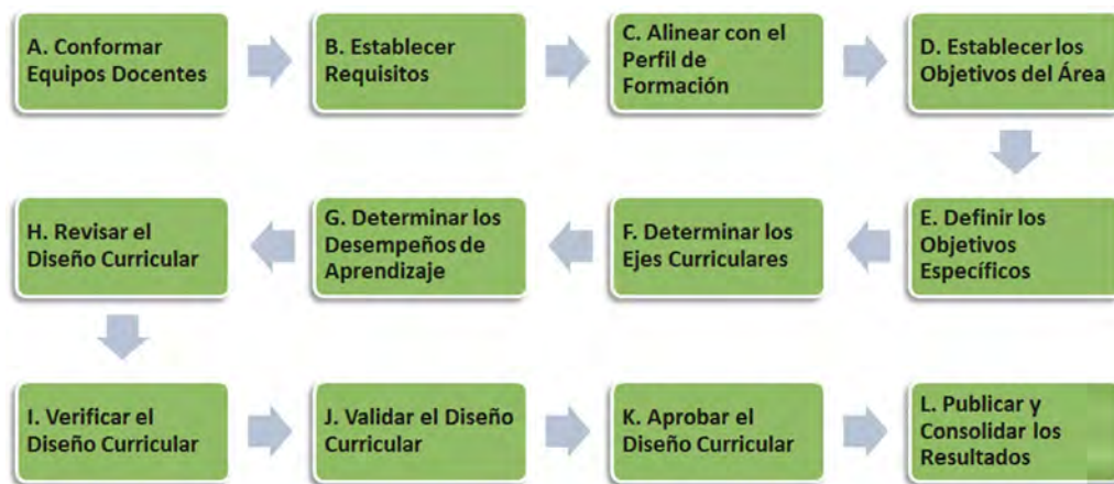
Figura 1. Etapas para dinamizar el proceso de diseño curricular

Es importante que los equipos de trabajo tiendan a: