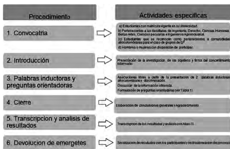
Figura 1. Protocolo para el desarrollo de grupos focales. Elaboración propia.

En lo relacionado con los estereotipos, se identifican que los estudiantes que no