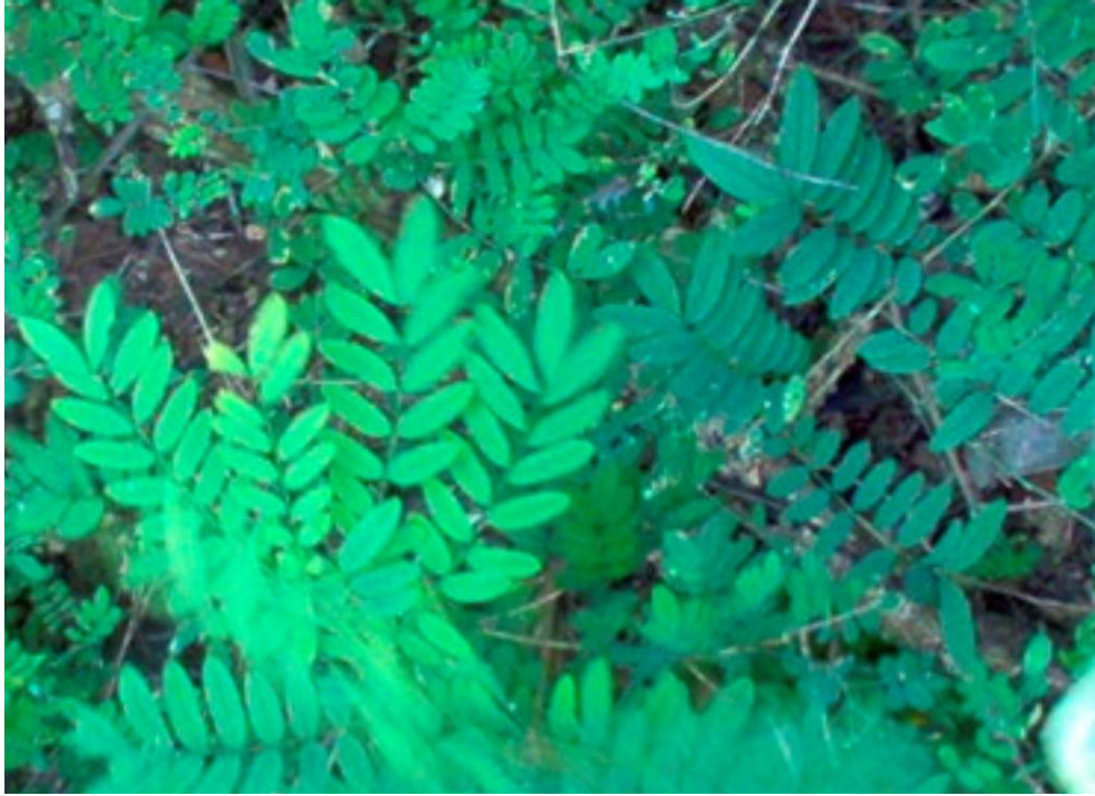
Figura 1.- Hojas de Macrolobium bicuspidum .

realizados siguiendo la normativa de la AOAC (1990).