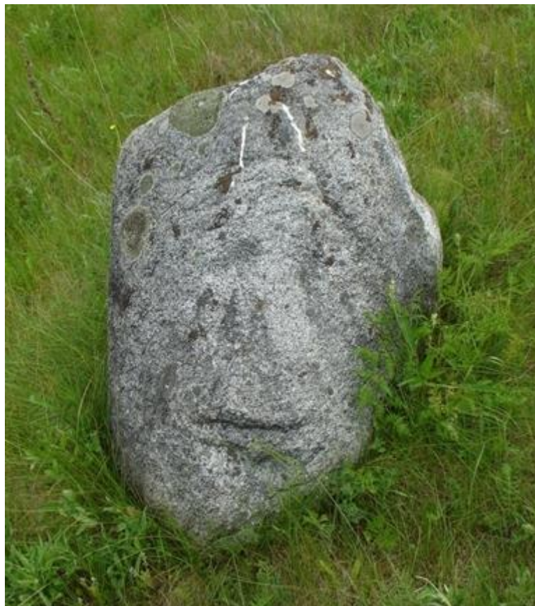
Рисунок 3. Кузовихинский идол

Особо можно выделить «Кузовихинского идола», найденного у восточного склона бывшей горы. Визуальный осмотр показал, что исследуемый объект имеет антропогенное происхождение и представляет собой антропоморфное каменное изваяние, изготовленное из зернистого по структуре камня. Размеры объекта составляют 0,7x0,5x0,4 м. На камне четко проступают отчетливые следы искусственной обработки. Голова вырублена рельефно из массива каменной глыбы. На лице изображены два близко посаженных глаза. Очень четко выбиты губы. Прослеживается достаточно толстый и широкий нос. На лбу — несколько глубоких горизонтальных канавок — можно предположить, что это — морщины (Рисунок 3).