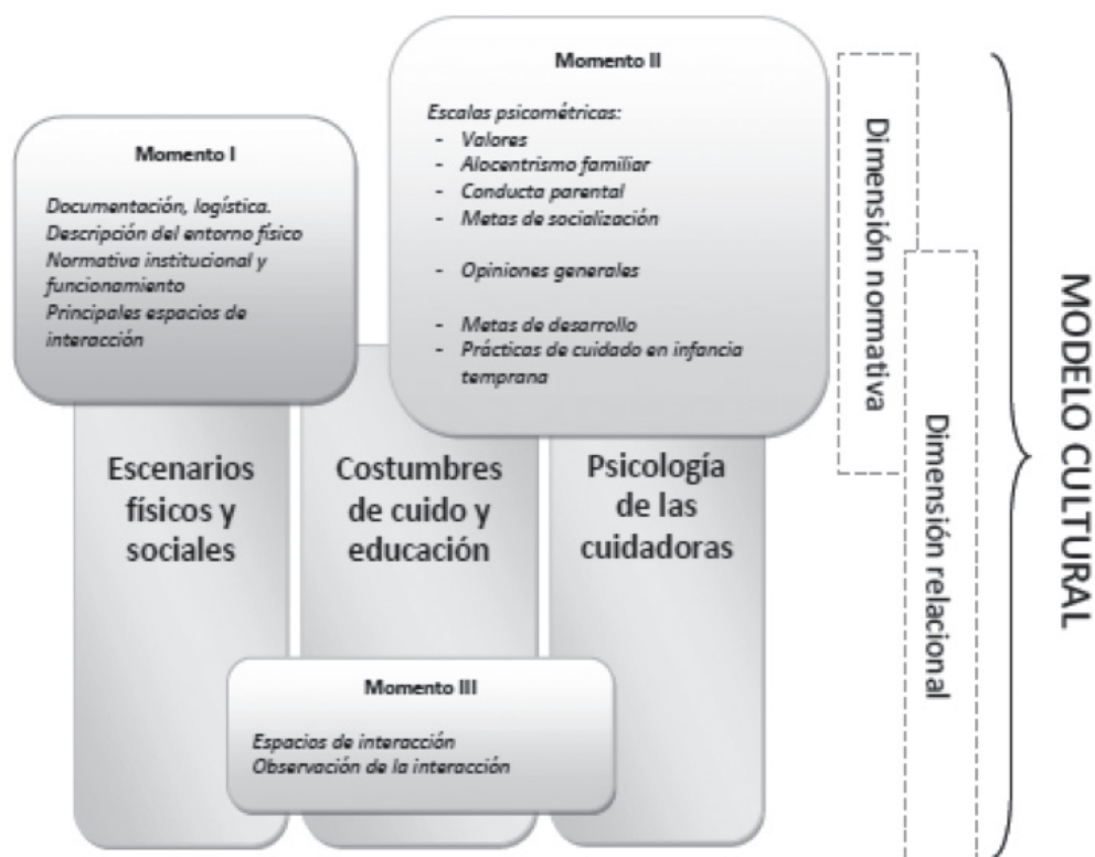
Figura 1. Diseño metodológico.

En la figura 1 se ilustra el diseño metodológico y la secuencia de aplicación de los instrumentos y las técnicas de recolección de información.