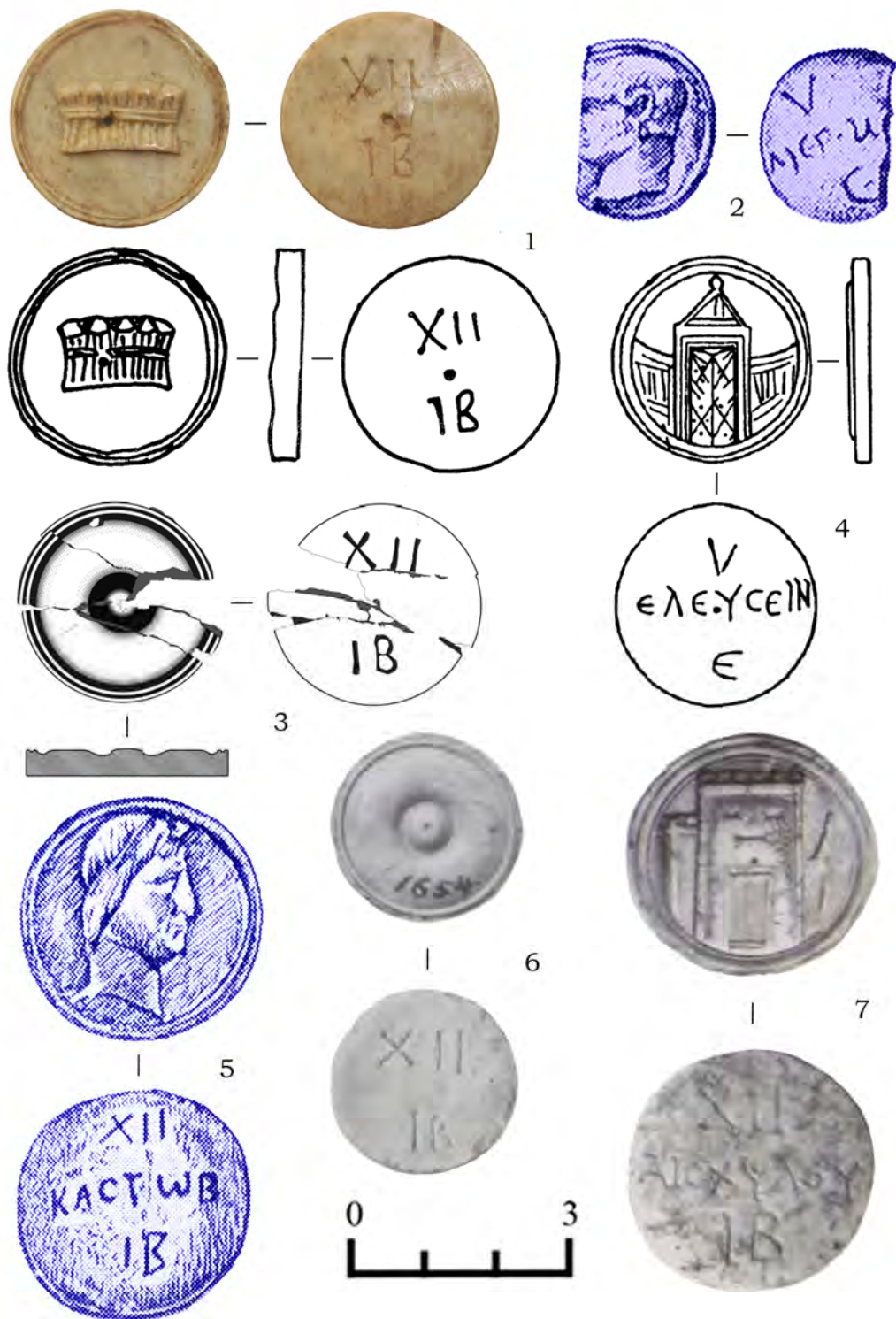
Рис. 1. 1 – Тира; 2 – Ольвия; 3 – Артезиан; 4 – Херсонес; 5 – Пантикапей; 6-7 – музей Кестнера.