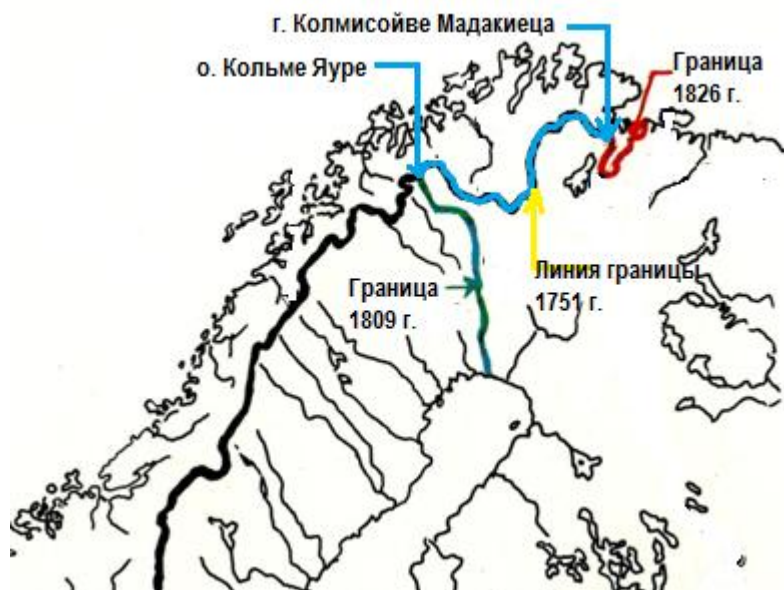
Рис. 4. Карта российско-шведско/норвежской границы к 1826 году.

Линия границы соответствовала старому датско-шведскому пограничному договору, утвержденному в 1751 году, и была приемлема для норвежской стороны, однако финский Сенат был возмущен фактом утверждения норвежско-финского участка имперской границы без участия делегатов от финской стороны.