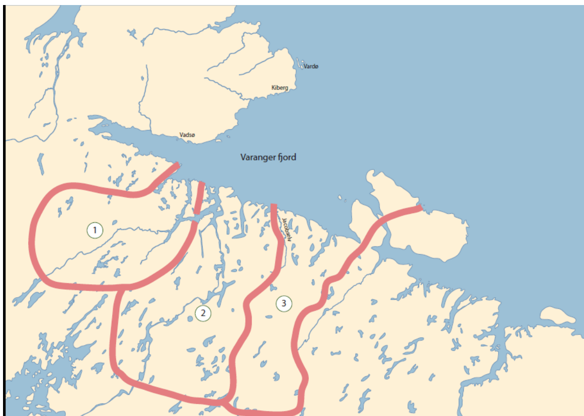
Рис. 2. Карта сийт скольтов. 1 – Нявдемский сийт (Нейден нор.), 2 – Пазрецкий сийт (Пасвиг нор.), 3 – Печенгский сийт (Пейсен нор.) (Голдин, 2015: 522-523)

Первым судьбоносным событием стала русско-шведская война 1808–1809 гг. Летом 1807 г. в Тильзите русский император Александр I заключил союз с Наполеоном. Одним из пунктов договора стало участие России в континентальной блокаде и, если потребуется, силовое принуждение Швеции к участию в наполеоновском блоке. Итогом договоренностей явилась война и Фридрихсгамский мир, по результатам которого Швеция утратила Финляндию. Суоми стокгольмский двор уступал России и попадал в континентальную блокаду (Бородкин, 1909: 24, 31-33; Мейнандер, 2008: 76-77). Присоединение Финляндии к России сильно ослабило позиции Швеции как в региональной, так и в общеевропейской перспективе. Фактически она выбывала из группы великих держав.