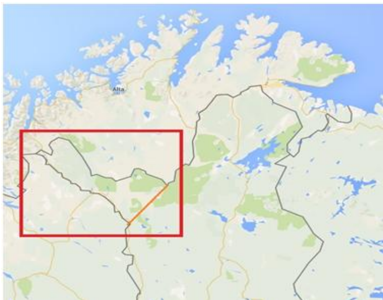
Рис. 1. Карта Северной Скандинавии с обозначением территории так называемого «Финского выступа»

Игнорируя в этом вопросе «финский фактор», отечественные исследователи М.М. Бородкин и В.В. Похлебкин интерпретировали дипломатическое предложение реваншистскими настроениями императора Николая I, осознавшего несправедливость пограничной конвенции 1826 г. в отношении русских лопарей – жителей Архангельской губернии, хотя сопоставление источников говорит нам об обратном (Бородкин, 1915: 313-314; Похлебкин, 1997: 48-61).