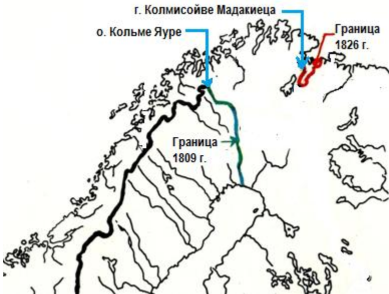
Рис. 3. Карта российско-шведско/норвежской границы начала XIX в.

Изначально фигура «русской угрозы» сложилась в Швеции, которая имела большой исторический, но достаточно неудачный для Королевства в XVIII в. опыт борьбы с Россией за доминирование в Балтийском регионе. Периодические длительные войны в течение одного столетия лишь упрочивали миф о желании России захватить Швецию или отторгнуть часть ее территорий. В XVIII в. Швеция воевала с Россией три раза общей длительностью двадцать лет. Последний конфликт 1808–1809 гг., по результатам которого Швеция утратила около 45 % своих владений, создал прочный фундамент для веры в постоянство русской опасности. Внешне формируется представление о Швеции как о жертве экспансионистской политики России (Åselius, 1994; Мезин, 2003). Данные о причинах конфликтов опровергают этот факт. Известно, что шведско-русские конфликты после Северной войны 1700–1721 гг. были вызваны нежеланием России поглотить шведские территории, а в первую очередь реваншистскими настроениями шведских элит. Несмотря на видимую иррациональность оснований, миф был достаточно выгоден элитам для легитимации реваншистской политики и формирования системы государственной безопасности.