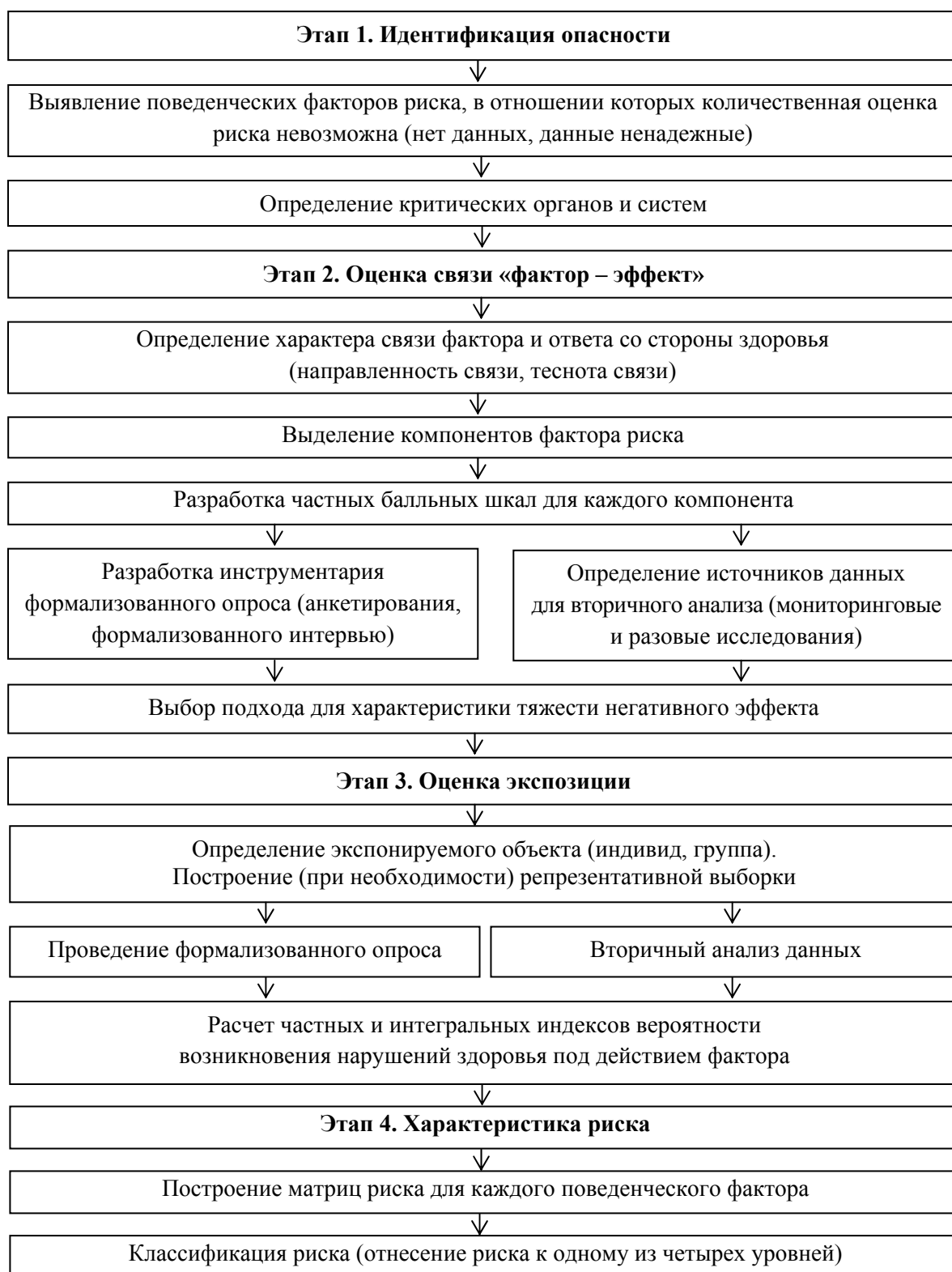
Рис. 1. Алгоритм полуколичественной оценки риска, связанного с воздействием поведенческих факторов на здоровье населения

В России специальных систематических исследований поведенческих факторов риска здоровью на национальном уровне не проводится. Некоторые выводы об особенностях об-