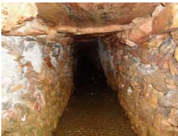
Figura 13 - Interior da galeria do século XVIII, aberta à visitação turística, no Veloso, com nascente no seu interior.

A mineração de galeria (FIG. 13), antes rara, intensificou-se a partir das décadas finais do século XVIII, paralelamente às lavras de céu aberto. Muitas galerias da Serra do Veloso se apresentam em bom estado, com nascentes em seu interior.