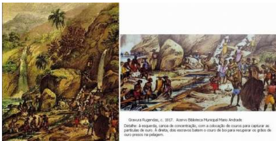
Figura 5 – Lavagem de ouro junto ao Itacolomi, com a interessante indicação da divisão do trabalho praticada nas lavras, para escravos de ambos os sexos. Fonte: Gravura de Rugendas, (1817).

O procedimento corrente era simples: demarcava-se a “canoa”, onde se processava a concentração do minério, desviando e represando parte da corrente, de modo a aumentar sua velocidade de arrasto do minério. Lá se despejava a areia a ser lavada, retirada do leito. Na extremidade da canoa, assentavam-se couros de boi (ou cobertores de baeta), com a pelagem oposta à direção da corrente, de jeito a reter as partículas de ouro, mais pesadas, dando passagem à areia comum. É um processo que provoca o assoreamento e turvamento das águas, mas ainda bastante usado no Tripuí (também chamado de Funil e Ribeirão do Carmo, uma das principais nascentes do Rio Doce). Uma excelente representação da técnica pode ser vista na conhecida gravura de Rugendas (FIG. 5):