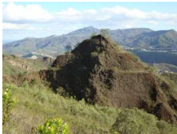
Figura 6 - Lavra a céu aberto, Corte de talho escalonado, século XVIII – Grande cava na Serra do Veloso.

despedaçada e acumulada, nos morros, sem qualquer cuidado, após a remoção da frágil cobertura vegetal.