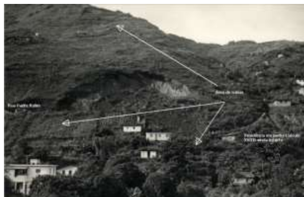
Figura 7 – Movimento de massa catastrófico, sem vítimas fatais, ocorrido no período de chuvas 1978-79, obstruindo a rua, ainda esparsamente povoada.

Isso ocasionou o a emergência de processos erosivos acelerados, aterramento de drenos naturais, acúmulo de pilhas de rejeitos à meia encosta, instabilidade de taludes e rochas de maiores dimensões, que representam, ainda hoje, grande perigo para as residências situadas abaixo, particularmente na rua Padre Rolim, que dividiu as lavras ao meio, em 1960 (FIG. 7 e 8).