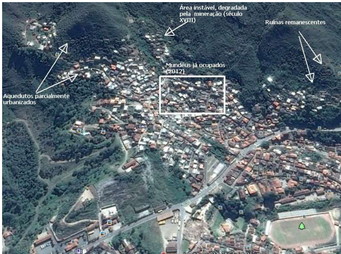
Figura 3 - Situação do Sítio arqueológico da serra do Veloso, em 2012.

rede de arruamentos caóticos e desprovidos de serviços públicos. Como consequência, áreas mineradas do passado (FIG. 2), “na maioria das vezes com características morfológicas e geotécnicas desfavoráveis foram ocupadas (FIG. 3), gerando um quadro problemático no que se refere à segurança da população e das estruturas” (SOBREIRA; FONSECA, 1992, p. 5).