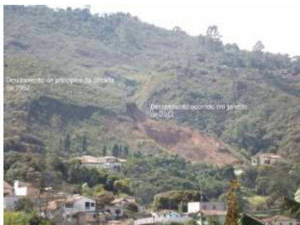
Figura 9 - Desastre ocorrido em 3 de janeiro de 2012, na rua Padre Rolim, ao lado da cicatriz do desmoronamento do início da década 1960.

Há indícios adicionais de grandes movimentos de massa ocorridos, em passado mais remoto e em décadas recentes, como o ocorrido em 14 de dezembro de 1995, com 3 vítimas fatais e um ferido. No dia 3 de janeiro de 2012, houve outro desabamento na rua Padre Rolim, com o soterramento de parte da rodoviária e morte de um taxista, ao lado da cicatriz de outro mais antigo, ocorrido no início da década de 1960, no mesmo local (FIG. 9).