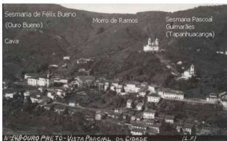
Figura 1 - Sesmarias da Serra do Ouro Preto, Acervo Luiz Fontana, circa 1940. Fonte: Arquivo Histórico Municipal de Ouro Preto-MG.

Como subsídios a um estudo dessa natureza, que privilegie a intervenção humana sobre o ambiente, numa cidade mineradora colonial, esse artigo focaliza e descreve os vestígios de extração mineral e ruínas de uma grande lavra, na Serra do Veloso, aos pés da qual se ergueu o arraial do Ouro Preto, um dos dois que compunham Vila Rica, ao longo do século XVIII. Como fontes preferenciais, destacam-se as crônicas de autores contemporâneos, a literatura sobre o tema, material iconográfico, documentação manuscrita específica sobre a ocupação da área e os próprios remanescentes físicos das lavras, no território escolhido. Considerando a abordagem de longa duração, o recorte temporal situa-se entre a expedição da carta de sesmaria de Félix Bueno, em 1714 e alcança o tempo presente.