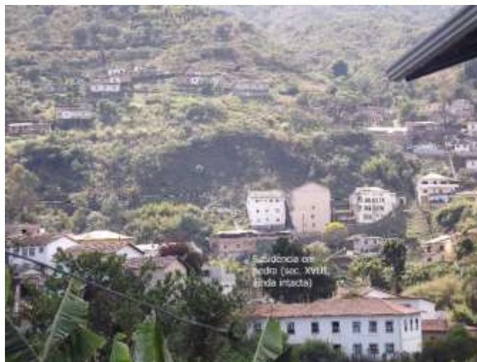
Figura 8 - Situação atual de ocupação, acima e abaixo do desmoronamento da foto anterior, na rua Padre Rolim. em 5 de agosto (2014).

Há indícios adicionais de grandes movimentos de massa ocorridos, em passado mais remoto e em décadas recentes, como o ocorrido em 14 de dezembro de 1995, com 3 vítimas fatais e um ferido. No dia 3 de janeiro de 2012, houve outro desabamento na rua Padre Rolim, com o soterramento de parte da rodoviária e morte de um taxista, ao lado da cicatriz de outro mais antigo, ocorrido no início da década de 1960, no mesmo local (FIG. 9).