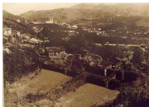
Figura 11 - Bateria em dois níveis de mundéus da mina “Lavras do Tanque” ou Lavras do Veloso (hoje ocupados), s.d..

Nessa forma de lavra, foram construídos aquedutos em curva de nível para condução de água (FIG. 10) e enormes estruturas de pedra, denominadas tanques ou mundéus (FIG. 11 e 12), dos quais restam exemplares perfeitamente preservados, em toda a serra do Ouro Preto, sendo que os maiores ainda se encontram na serra do Veloso.