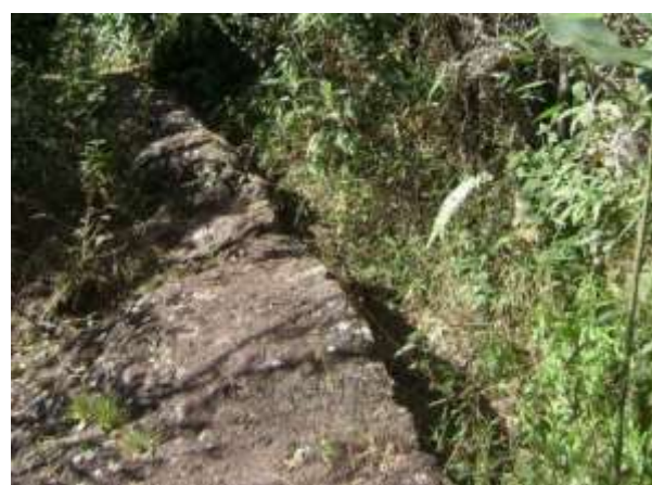
Figura 10 - Aqueduto escavado na camada de tapanhuacanga – Serra do Veloso.

Essa forma destrutiva de trabalhar as lavras foi intensa, com duração superior a um século e meio, empregando centenas de escravos. Essa circunstância desfigurou completamente a paisagem e o meio ambiente, alterando a topografia original, testemunhada por raras manchas ainda cobertas por crosta de tapanhuacanga remanescente (CASTRO et al, 2012).