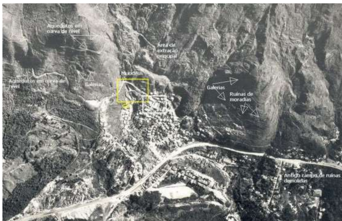
Figura 2 - Situação do sítio arqueológico do Veloso (Serra do Ouro Preto), em 1960.

Ao final do século, ao perder o status de capital do estado, Ouro Preto sofreu um esvaziamento econômico e político, acompanhado de uma expressiva redução demográfica, especialmente nos bairros periféricos. Essa conjuntura contribuiu para preservar o notável conjunto arquitetônico do núcleo central, assim como o campo de ruínas na área dos morros, onde se localizavam a maior parte dos remanescentes das instalações da mineração do ouro (FIG. 2). Com o início da mineração de bauxita e fabricação de alumínio, na década de 1940, a cidade retomou o desenvolvimento e acelerou o crescimento demográfico, intensificado a partir de 1970.