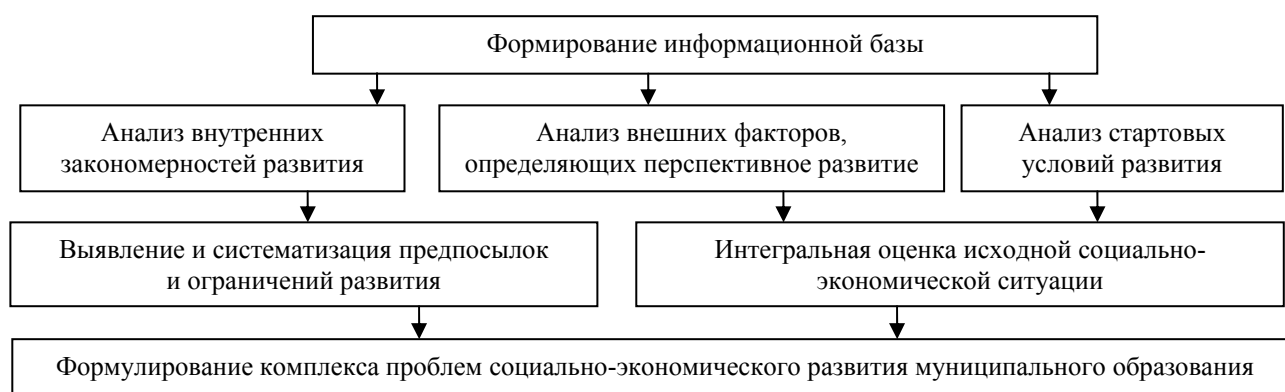
Рис. 2. Принципиальная схема анализа и оценки информационной базы в рамках стратегического планирования социально-экономического развития территории

Аналитический этап с трудом поддается определенным шаблонам в отношении каждого отдельно взятого муниципального образования, его следует формировать исходя из специфики территории и субъекта управления. Также данный этап во многом определяется принятой в данном муниципальном образовании системой сбора информации и оценки социально-экономических процессов. Как показывает опыт, информационная база должна быть описана на конкретных и понятных всем сторонам показателях, адекватно описывающих существующие проблемы, сформированный стратегический выбор и ожидаемый эффект от предлагаемых мероприятий.