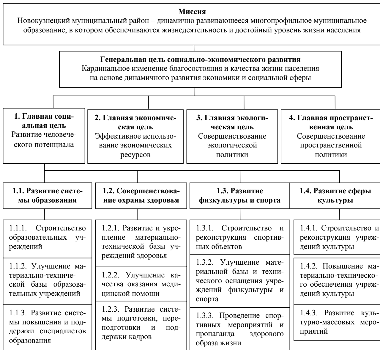
Рис. 4. Дерево целей социального развития Новокузнецкого муниципального района

Алгоритм формирования стратегического плана муниципального образования определяет порядок разработки его разделов и их взаимосвязь. Предложенный алгоритм ставит целью перед субъектом стратегического планирования не столько безмерное наращивание экономического потенциала территории (традиционный подход к стратегическому планированию развития территории), сколько определение достаточности имеющихся ресурсов для обеспечения социальной составляющей стратегического планирования (социально ориентированный подход).